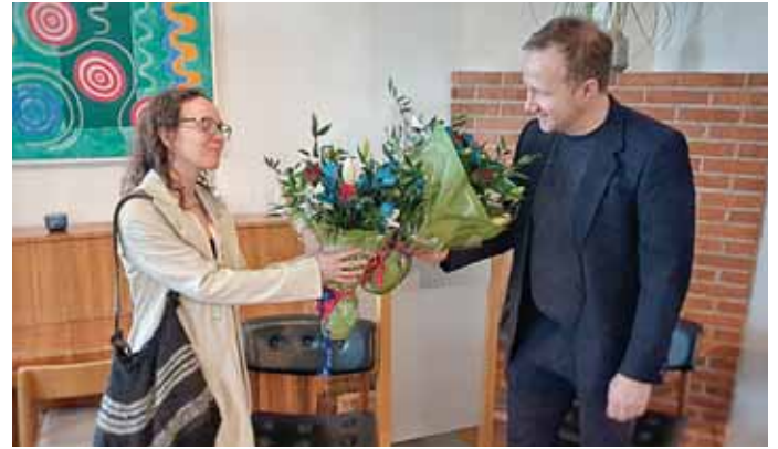
Mynd: Marteinn Þórsson.