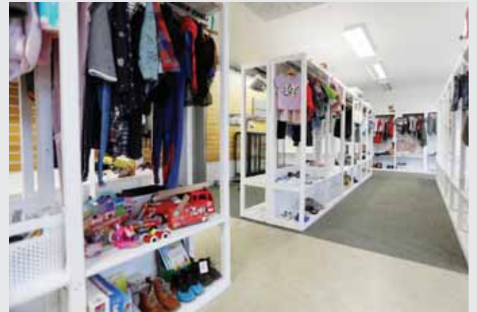
Margir gera góð kaup með notuð föt í versluninni.