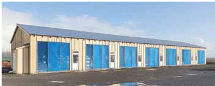
Á Laugarvatni er í byggingu 600 fermetra iðnaðarhúsnæði. Framundan er uppbygging á íbúðarhúsnæði og þá er áhugavert deiliskipulag að taka gildi með spennandi og fjölbreyttum lóðum.

Sveitarstjórn Bláskógabyggðar shefur á stuttum tíma útlutað þrem íbúðalóðum á Laugarvatni. Um er að ræða einbýlishúsalóð og tvær rað- og parhúsalóðir. Mikil vöntun hefur verið á íbúðum á Laugarvatni að undanförunu og því ætti uppbygging á þessum lóðum að vera kærkomin fyrir þá sem vilja setjast að á Laugarvatni. Það er ekki eingöngu uppbygging á íbúðalóðum að fara af stað, því nú er í byggingu á Laugarvatni iðnaðarhúsnæði sem er 600 fermetrar að stærð og skiptist í sjö iðnaðarbil.