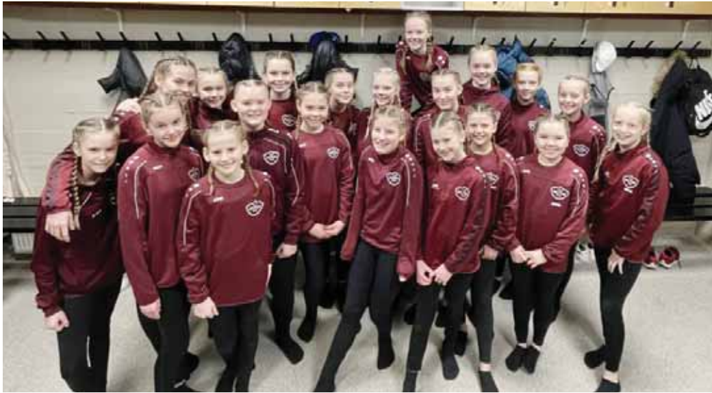
Stelpurnar í 3. flokki eru bikarmeistarar 2021.