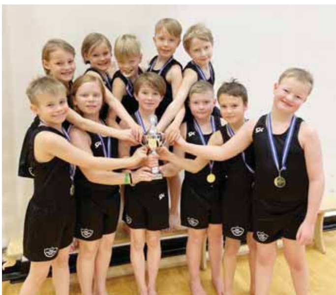
Strákarnir í flokki kk. yngri eru bikarmeistarar 2021.

Í flokki kk. yngri keppti einn hópur frá Selfossi. Strákarnir frá Selfossi sýndu flottar æfingar og