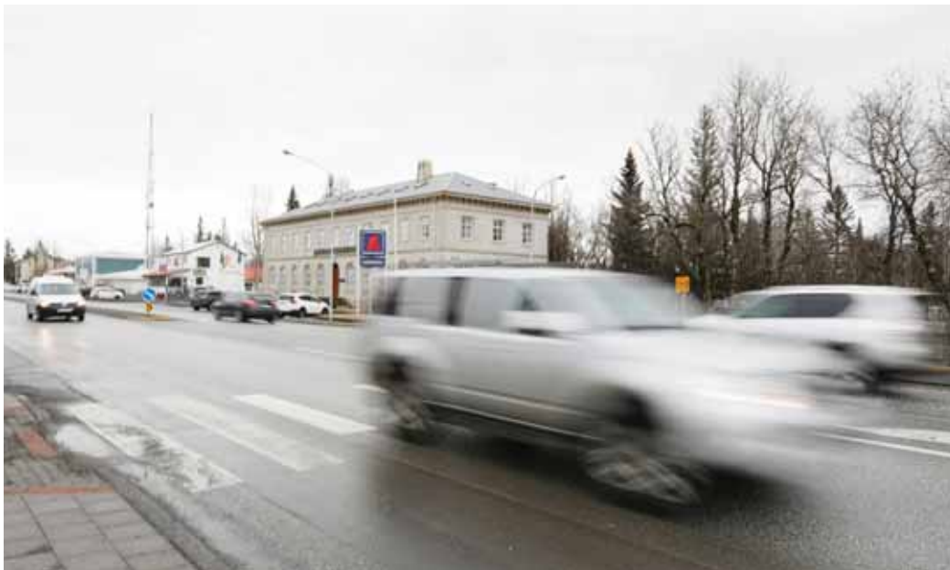
Umferðarhraði og umferðarhegðun er ekki alltaf með besta móti á Austurveginum.

Umferðarhraði og umferðarhegðun á Austurvegi, sem liggur gegn um Selfoss, er ekki alltaf til sóma, ef marka má umræður íbúa Árborgar á Facebook. Margóft hefur verið bent á það í greinarskrifum og á íbúasíðum að úrbóta sé þörf í ýmsum málum sem snúa að umgjörð Austurvegarins. Í liðinni viku varð atvik sem hefði getað farið illa og vakti athygli á Facebook-síðum íbúanna.