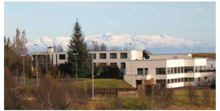
Kirkjubæjarstofa er flutt í heimavistarálmu Kirkjubæjarskóla. Gengið er inn þar sem íbúðirnar voru en aðgengi fyrir fatlaða er frá planinu við Íþróttahúsið.

Á Kirkjubæjarstofu hafa nokkrar stofnanir starfsstöð; Ráðgjafarmiðstöð landbúnaðarins, Bændabókhalidið, Fræðslunet Suðurlands símenntun,