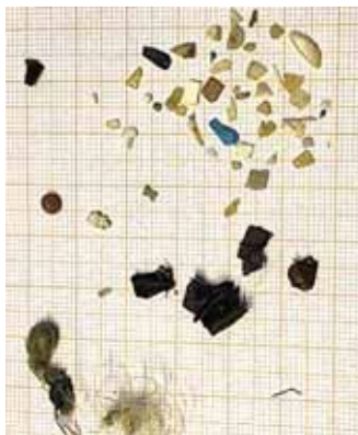
Plast sem fannst í meltingarvegi eins fýls sem safnað var 2020.

Í heild er búið að safna 121 fýl til plastrannsóknna á Íslandi frá árinu 2018 og af þeim hafa 67% verið með plast í meltingarvegi. Hlutfall fýla sem hefur haft meira en 0,1 g af plasti er 13% sem er lágt í samanburði við aðrar rannsóknir á plasti í meltingarvegi fýla við Norður-Atlantshaf.