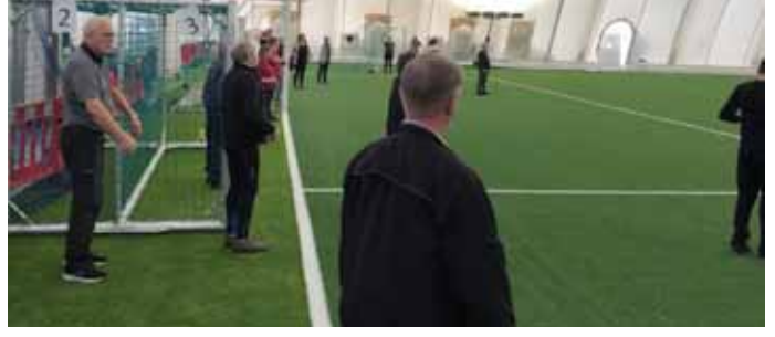
Heilsuræktarnámskeið fyrir íbúa 60 ára og eldri í Hveragerði hefur gengið vel. Um 90 manns sóttu námskeiðið í upphafi og gríðarstór hópur hittist þrisvar í viku og iðkar fjölbreytta líkamsrækt við kjöraðstæður undir handleiðslu kennara.