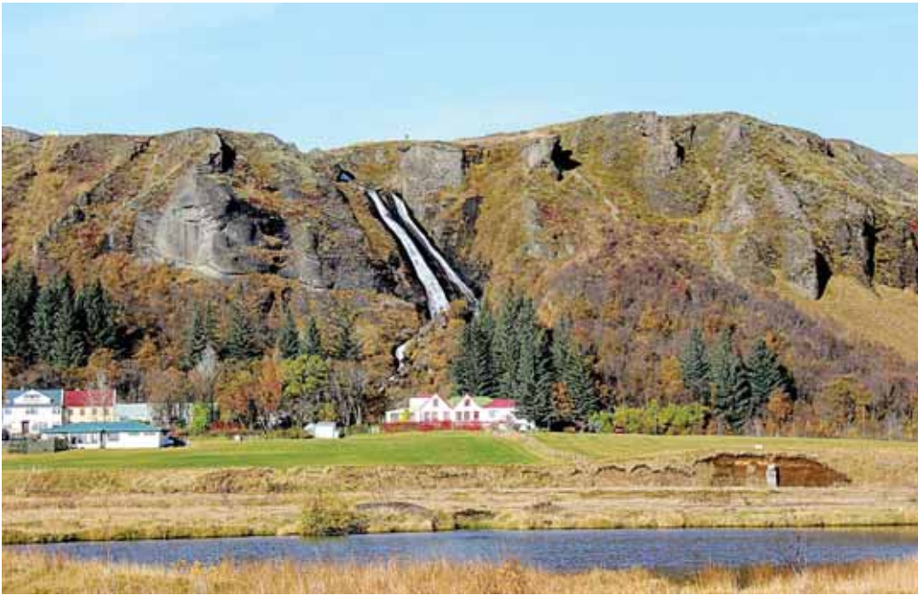
Ástarbrautin byrjar hjá Systrafossi. Uppi á brúninni er listaverkið Gullmolinn og flesta daga má sjá fólk á göngu.

Ástarbrautin er 5 km hringleið þar sem gengið er upp hjá Systrafossi, yfir Klausturheiðina, niður hjá Bjarnartættum og komið við á