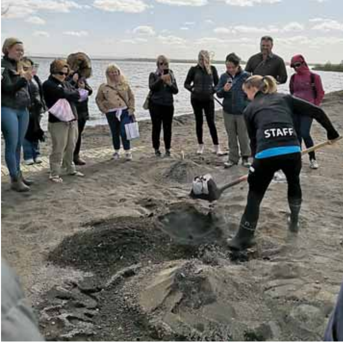
Löng hefð er fyrir brauðbakstri við hverasvæðið við Laugarvatn. Brauðið er látið bakast yfir sólarhring og gjarna borið fram með bleikju úr vatninu.

Tíminn hefur víða verið nýttur til góðra verka og búið í haginn til framtíðar í því óumbeðna hléi sem skapaðist í ferðaþjónustu í heimsfar-