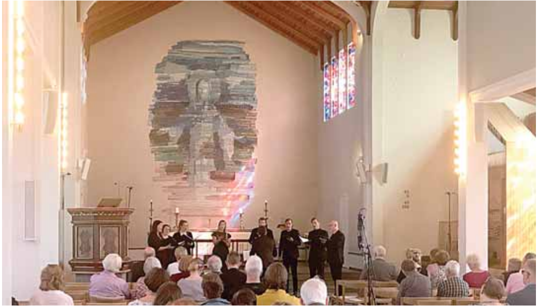
Frá sumartónleikum í Skálholti

Sjórn Samtaka sunnlenskra sveisarfélaga samþykkti á fundi sínum 24. mars úthlutun styrkveitinga úr Uppbyggingarsjóði Suðurlands, að undanengnu mati fagraða atvinnu og nýsköpunar og fagraðs menningar. Um var að ræða fyrri úthlutun Uppbyggingarsjóðs á árinu 2021. Umsóknir voru samtals 166. Í flokki atvinnuþróunar- og nýsköpunarverkefna bárust 67 umsóknir og 99 umsóknir í flokki menningarverkefna. Að þessu sinni voru tæpum 37 m.kr. úthlutað til 74 verkefna. Úthlutað var 16 m.kr. til 21 verkefnis í flokki atvinnuþróunar- og nýsköpunarverkefna og tæpri 21 m.kr. til 53 menningarverkefna. Raföld hlaut að þessu sinni hæsta styrkinn 1,5 m.kr. í flokki atvinnu og nýsköpunar fyrir verkefnið „Fjölnýting jarðvarma til orkuvinnslu í dreif-