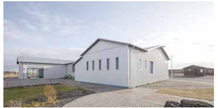
Barnaskólinn á Stokkseyri og Eyrarbakka, Eyrarbakkaútibú.

„Umsóknir í Sprotasjóð bera vitni um nýsköpun, samvinnu og grósku sem einkennir íslenska skóla. Þar er gríðarlegur metnaður og vilji til góðra verka sem mikilvægt er að styðja við,“ segir Lilja Alfreðsdóttir mennta- og menningarmálaráðherra.