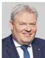
Sigurður Ingi Jóhannsson Samgöngu- og sveitarstjórnarráðherra Opnunarávarp: Vinna, búseta, hamingja.

Tækifærin á landsbyggðinni eru óteljandi. Störf án staðsetningar þurfa einungis tvennt: nettengingu og samgöngur. Covid hefur sannað að fólk getur sett lífsgæðin í forgang, flutt starfið með sér á sinn drauma búsetustað eða skapað tækifæri hvar sem er á landinu. Íbúum stórborga í Evrópu hefur fækkað undanfarið ár og smærri borgir og bæir hafa endurheimt sinn fyrri sjarma. Um ræðir gífurlega mikilvægt byggðamál og tækifæri til að halda landinu í byggð. Til að vel takist til er nauðsynlegt að styrkja samfélög á landsbyggðinni og bjóða upp á öflugan grunnþjónustu fyrir íbúa.