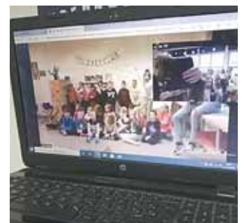
Börnin hittust á Zoom og sungu fyrir hvert annað.

Skv. tímaáætlun verkefnisins áttu fulltrúar hinna skólanna að koma í heimsókn sl. haust. Þeirri heimsókn var frestað þangað til ferðafrelsi verður aftur virkt í heiminum. Í þessari heimsókn ætluðu fulltrúarnir að leggja