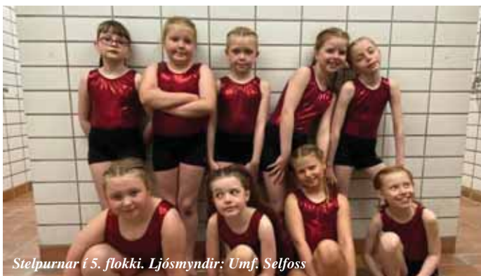
Stelpurnar í 5. flokki.