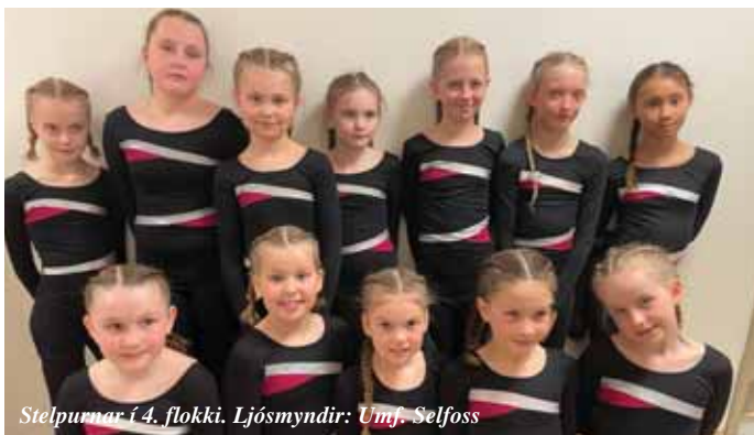
Stelpurnar í 4. flokki.