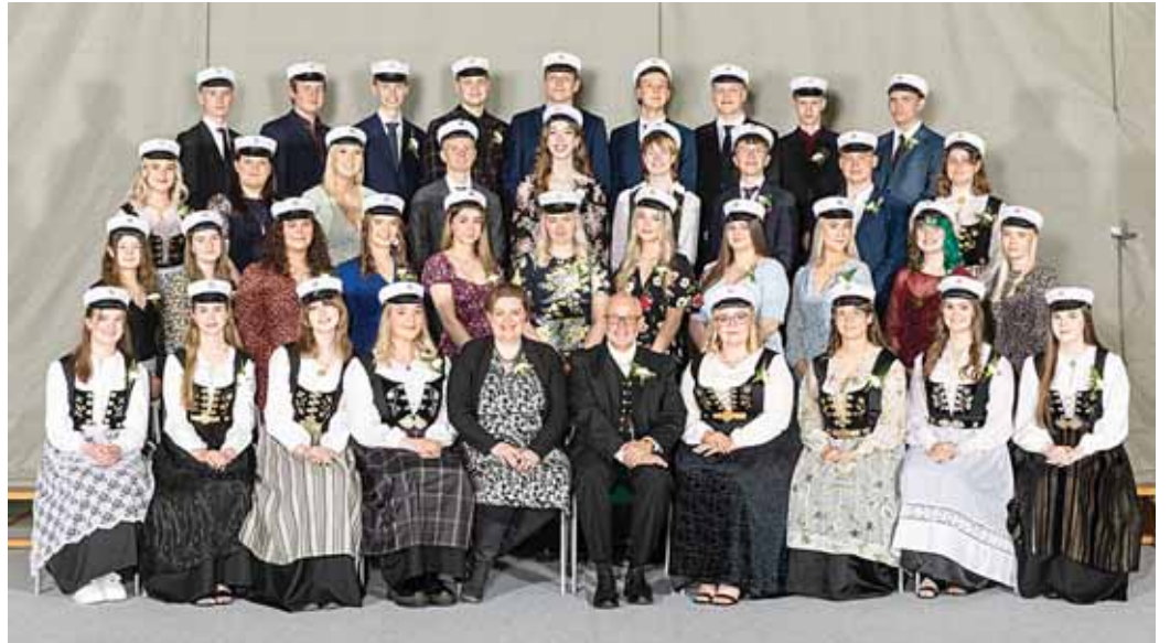
Nýstúdentarnir voru hátíðlega klæddir við útskrift sína, en 37 nýstúdentar útskrifuðust frá Menntaskólanum að Laugarvatni laugardaginn 22. maí sl.

Þrjátíu og sjö nýstúdentar brautskráðust frá Menntaskólanum að Laugarvatni nýliðinn laugardag, 22. maí. 200 manns voru á útskriftinni, nýstúdentar og fjölskyldur þeirra, starfsmenn skólans sem og nokkrir aðrir sem komu að hátíðardagskránni svo og einnig tæknimenn frá Sonik þar sem athöfninni var streymt. Salnum var hólfaskipt og allar sóttvarnareglur viðhafðar.