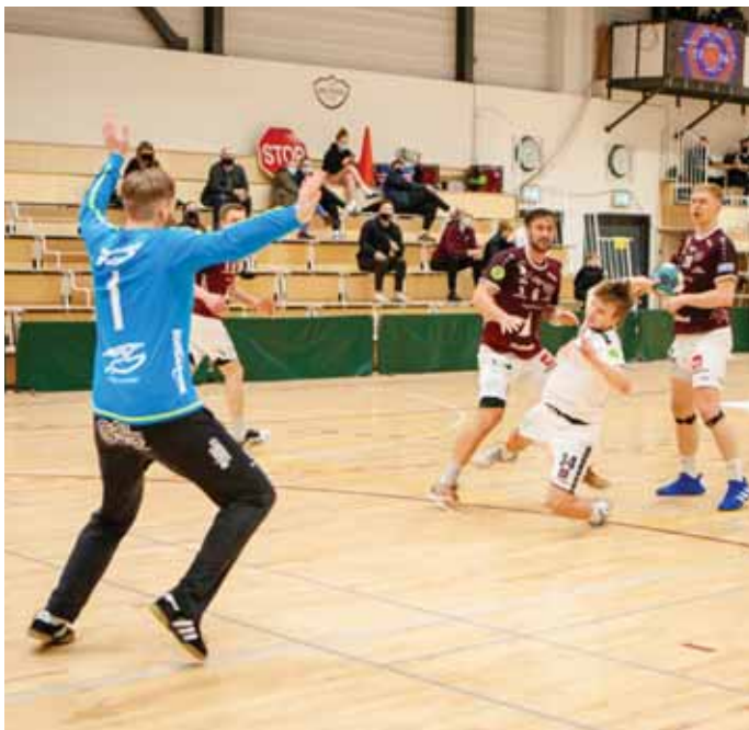
Vilnius Rasimas varði vel í markinu.

Hleðsluhöllinni á föstudag. Leiknir verða tveir leikir og mun samanlögð markatala úr þeim ráða úrslitum. -Umf. Selfoss/esó