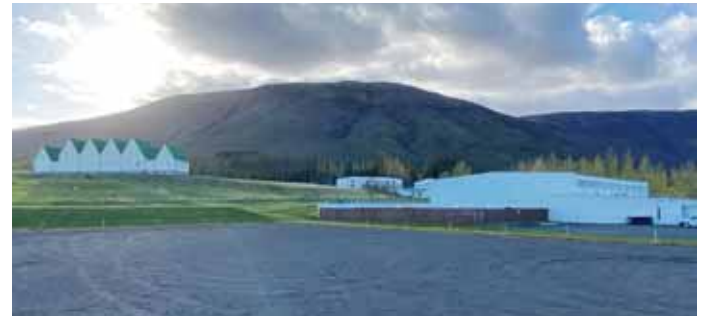
Á þessum fallega stað á Laugarvatni er ráðgert að húsnæði fyrir skipulags- og byggingafultrúa risi.

gestir geti staldrað við í fallegu umhverfi og notið alls þess sem Gróðurhúsið hefur uppá að bjóða. Hálfán Pedersen sér um heildar hönnun og útlit Gróðurhússins en samvinna er með Flóru garðyrkjustöð um ráðgjöf um gróður hússins sem að sjálfsögðu er í aðalhlutverki í sjálfum Blómabænum.