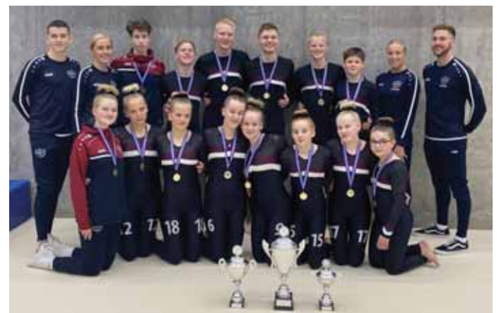
Krakkarnir í 1. flokki mix fögnuðu Íslandsmeistaratitli.

Liðin sex frá Selfoss sem kepptu á Íslandsmótinu komust öll á verðlaunapall og tóku heim á Selfoss fjóra titla, tvo deildarmeistaratitla og tvo deildarmeistaratitla. Þetta verður að teljast einstakur árangur og viljum við óska iðkendum og þjálfurum fimleikadeildar Selfoss til hamingju með árangurinn. -UMFS/sóh