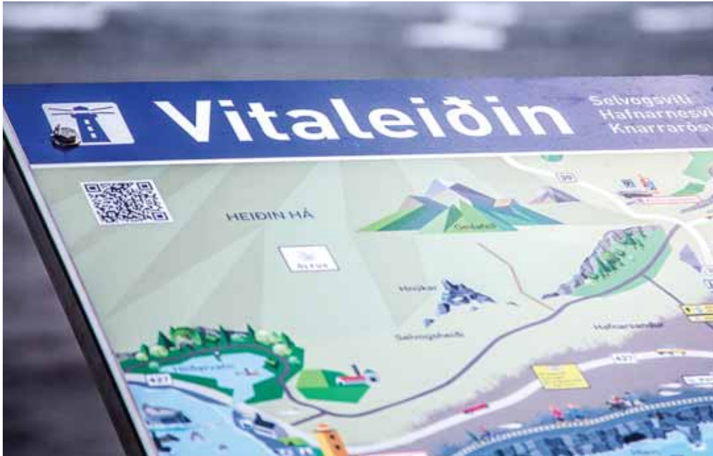
Um að gera að kynna sér Vitaleiðina betur, bæði fyrir heimamenn og aðkomufólk.

Laugardaginn 12. júní nk. Lopnar nýjasta ferðaleið Suðurlands sem nefnist Vitaleiðin. Leiðin er tæplega 50 km og liggur frá Selvogsvita í vestri að Knarrarósvita í austri. Vitaleiðin býður upp á fjölbreyttan ferðamáta meðfram strandlengjunni, heimsóknir inn í þrjú þorp og þrjá vita.