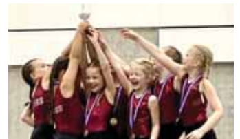
Stelpurnar í 5. flokki fögnuðu Íslandsmeistaratitli.

Því næst var komið að keppni í 1. flokki blandaðra liða. Krakkarnir er nýkrýndir bikarmeistarar unglíngja. Eftir harða baráttu við Hött sigraði lið Selfoss og eru þau Íslandsmeistarar 2021. Liðið var með flest stig eftir deildarkeppnina og voru því einnig krýnd deildarmeistarar 2021. Stórglæsilegur árangur hjá mix liðinu sem átti gott mót og geislaði af leikgleði. Frábært