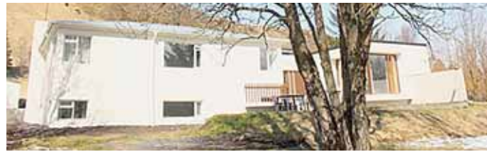
Þar sem mætast nýi og gamli hlutinn er notalegur pallur.

Prestsbústaðurinn á Kirkjubæjarklaustri setur mikinn svip á þorpið þar sem hann stendur í stórum garði beint á móti Kirkjubæjarskóla á Síðu. Húsið var reist 1939 og byggt við það 1973. Húsið var orðið afskaplega illa farið en hefur nú verið endurgert og má sannarlega þakka yfirmönnum þjóðkirkjunnar fyrir þær myndarlegu framkvæmdir.