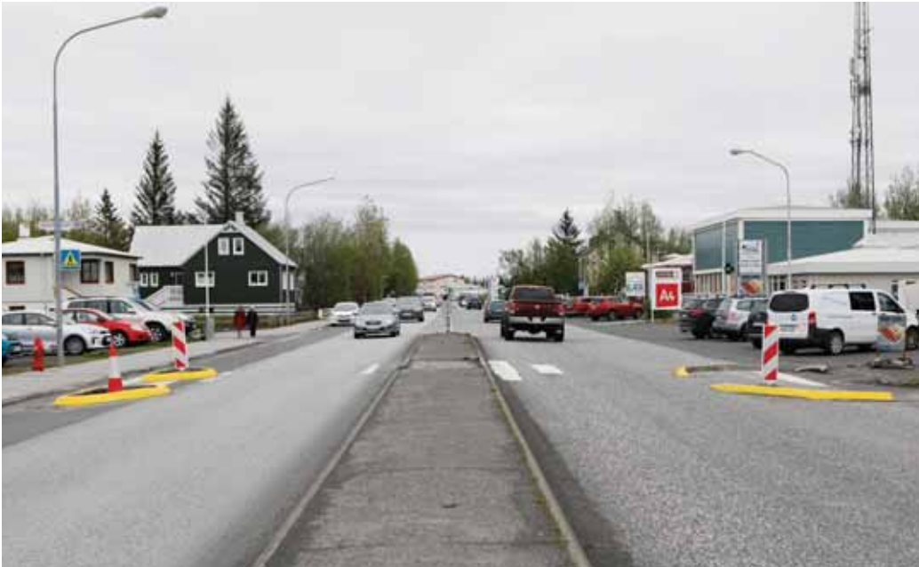
Búid er að setja upp þrengingar við gangbrautir á Austurveginum á Selfossi. Það kemur í veg fyrir að ökumenn taki fram úr bifreiðum sem stöðvað hafa fyrir gangandi vegfarendum á leið yfir gangbrautina.

Í mars sl. greindi blaðið frá því þegar barn var sett í hættu vegna framúraksturs við gangbraut á Austurvegi á Selfossi. Vegurinn er frekar breiður og gefur fólki tækifæri á að gera einhverjar kúnstir, en ökumaðurinn tók hægra megin fram úr ökutæki sem stöðvað hafði fyrir gangandi vegfaranda. Ábendingar bárust til blaðsins frá íbúum vegna málsins og samfélagsmiðlar loguðu. Blaðið ræddi við íbúa sem lýstu áhyggjum sínum af ástandi mála.