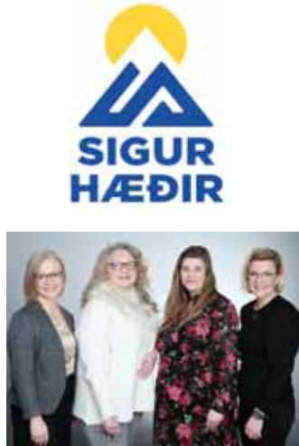
Starfsfólk Sigurhæða tekur vel á móti konum sem eru eða hafa verið þolendur ofbeldis.

Innan Sigurhæða er boðið upp á einstaklingsviðtöl, stuðningsviðtöl, ráðgjöf, hópmeðferðarstarf, viðtöl við lögreglu og ráðgjöf frá Kvennaráðgjöfinni um lagaleg málefni. Í hópmeðferðarstarfinu hittist hver hópur 10 sinnum og er meðal annars beitt aðferðum listmeðferðar í hópastarfinu. EMDR áfallameðferðin er gagnreynd sálfræðimeðferð sem er ætluð skjólstaðingum Sigurhæða á síðari stigum meðferðar. Með EMDR meðferð er hægt að meðhöndla hvoru tveggja, nýleg eða eldri áföll skjólstaðinga og ekki er gerð krafa um greiningu áfallastreitu til að meðferð geti hafist. Í EMDR er skjólstaðingur leiddur með ábyrgum hætti í gegnum þá erfiðu upplifun sem áfallið felur í sér, hvort sem um eitt einstakt tilvik er að ræða, eða upplifun erfiðrar lífeyrnslu sem hefur varað yfir tíma. Skilgreining á áfalli miðast við alvarlega streituvaldandi lífsreynslu sem hefur ógnað lífi, heilsu og/eða sjálfsmynd viðkomandi og áfallameðferðar er þörf af skjólstaðingur upplifir að reynslan fylgi honum og hann nái ekki að komast yfir hana af