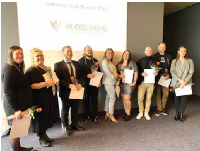
Útskriftarhópurinn í Menntastöðum.

Það gaf mér ótrúlegt sjálfs- öryggi og trú á sjálfa mig að ljúka Menntastöðum. Ég gat unnið með öðru fólki í hóp, ég gat hjálpað, ég þorði að spyrja spurninga og tjá mig. Ég gat lært! Ég þori að standa hér fyrir framan fullt af ókunnugu fólki og segja hluta af minni sögu, með von um að það hjálpi ein- hverjum. Ég er ekkert unglamb, en maður er aldrei of gamall til að láta drauma sína rætast.“