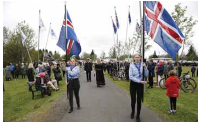
Fjallkonan í fylgd skáta og lögreglu