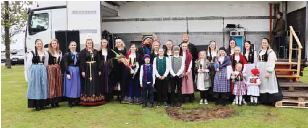
Það er hátíðlegt þegar fólk klæðist þjóðbúningum á hátíðisdögum. Hér er fengulegur hópur fólks að fagna þjóðhátíðardeginum í Rangárbíngi eystra.