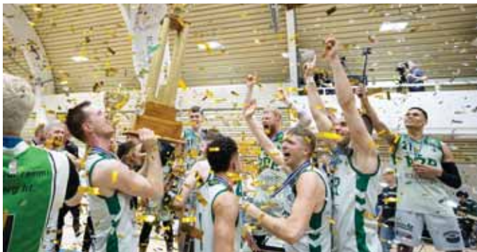
Það var mikið fagnað þegar bikarinn fór á loft.

Keflvíkingar byrjuðu leikinn sterkari og virtust staðráðnir í að knýja fram oddaleik á sunnudeginum. En Þórsarar voru aldrei langt undan og náðu í miðjumannan leikhlutu að jafna stöðuna. Í seinni hálfleik voru Þórsarar alltaf skrefi á undan Keflvíkingum og náðu þeir svo endanlega að slíta þá frá sér um miðjan fjórða leikhlutu. Gestirnir reyndu hvað þeir gátu til að komast aftur inn í leikinn en heimamenn héldu sínu striki. Þegar