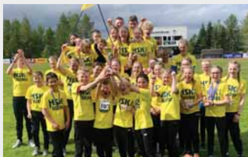
Lið HSK/Selfoss fagnar sigri á mótinu.