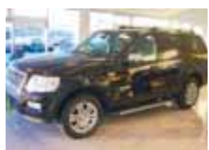
Ford Explorer Limited, árg. 2006 ek. 33.þ km 4000cc, ssk., Dvd, leiðsöguk. Toppluga leður, einn með öllu. Verð 4.900.þús Getum bætt bílum á plan og skrá. S. 567 4000.

Heimsbílar Kletthálsi 2, 110 Reykjavík Sími: 567 4000 www.heimsbilar.is