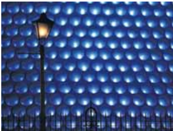
Byggingin er þakin álkringlum sem eru lýstar upp með bláu ljósi.