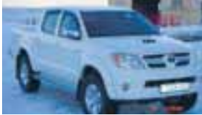
Nýr bíll til sölu Hilux D/C 3.0 SR, ssk., dísil, 33" hækkin, filmur í rúðum, álfelgur, sætacover, guggahlífar, sumardekk og nagladekk, litur hvítur. Engin skipti. Uppl. í s. 892 0566.