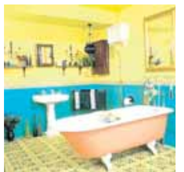
Fæst okkar eru húsmæðraskólagengin en það breytir því ekki að flestir vilja hafa fint heima hjá sér þegar von er á gestum í bæinn.

5. Ilmkerti. Ef þú átt ekki slíka mun-aðarvöru þá máttu nota reykelsi eða annað sem gefur góða lykt. Góður