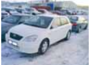
Toyota Corolla 1.6 VTI. Árg 06/03. Ekinn 70 þ. km. Sjálfsk. Verð 1.390.000. Áhvl 860 þús.