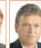
Kristjón Ígússon sölu a ur

Opið mán. til fim. 8.30-18, fös. 8.30-17. Þjónustus. eftir lokun 691-8616