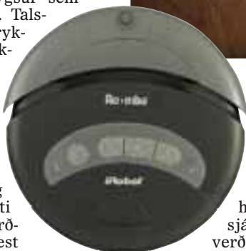
Roomba er kringlótt og lág.

Hægt er að forrita ryksuguna til að þrifa á ákveðnum tímum. Til dæmis er mjög hentugur tími meðan fólk er í vinnunni enda hlýst þá minnst ónæði af henni.