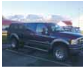
Þessi gullfallegi Ford 350, Lariat, árg. 12/2005 er til sölu. Mikió af aukabúnaði. Ek. aðeins 16.000 km engin hraðatakmarkari. Uppl. 461 7800 & 894 5985.