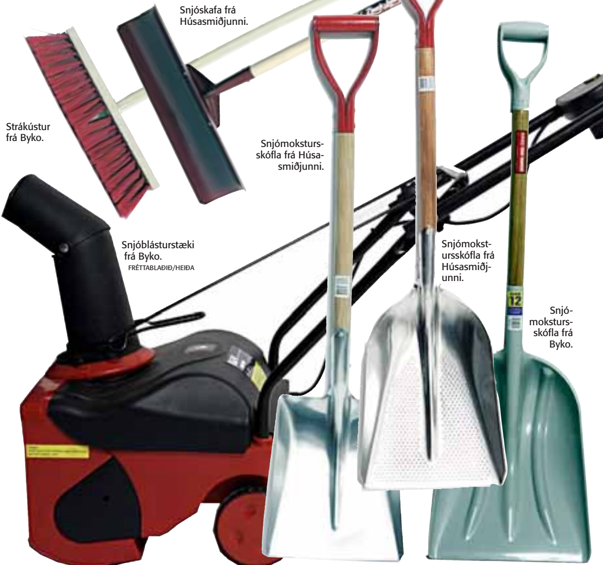
Strákústur frá Byko.

Hér eru nokkrar góðar hugmyndir að útivistarfatnaði og snjómoksturverkfærum sem ættu að koma flestum að góðum notum. -ve