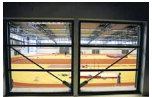
Ný tengibygging Laugardalshallar er 9.500 fermetrar. Auk frjáls-íþróttaiðkunar er hún nýtt sem veislusalur og tónleikavettvangur, þó hún henti illa til slíks.