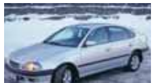
Til sölu Avenis árg. '99, silfurgrár, ek.122 þús. Aðeins 2 eigendur. Uppl. í s. 858 8171.

100 bílar ehf Funahöfða 1, 110 Reykjavík Sími: 517 9999 Opíð virka daga 10-19 og laugardaga 12-17 www.100bilar.is