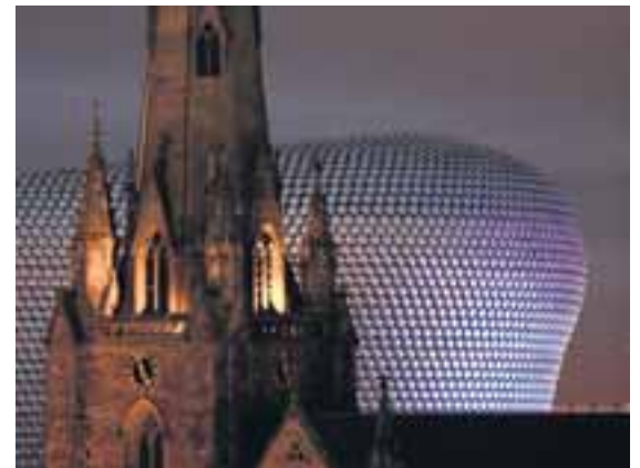
Selfridges-byggingin er eitt vinsælasta kennileiti Bretlands.