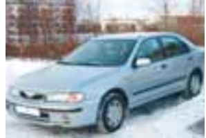
Góður fjölsk.bíll. Nissan Alm. árg. 2000. Nýsk. 2008. S- & V-dekk. V. 494 þús. S. 899 3267.