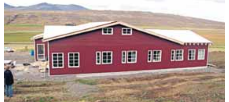
Timburhús fara vel í íslenskrí náttúru.