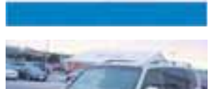
MMC Montero Limited, árg. 2001 ek. 124.þ.km, leður, toppluga, einn með öllu. Verð 2.200.þús áhv 1900.þús Getum bætt bílum á plan og skrá. S. 567 4000.