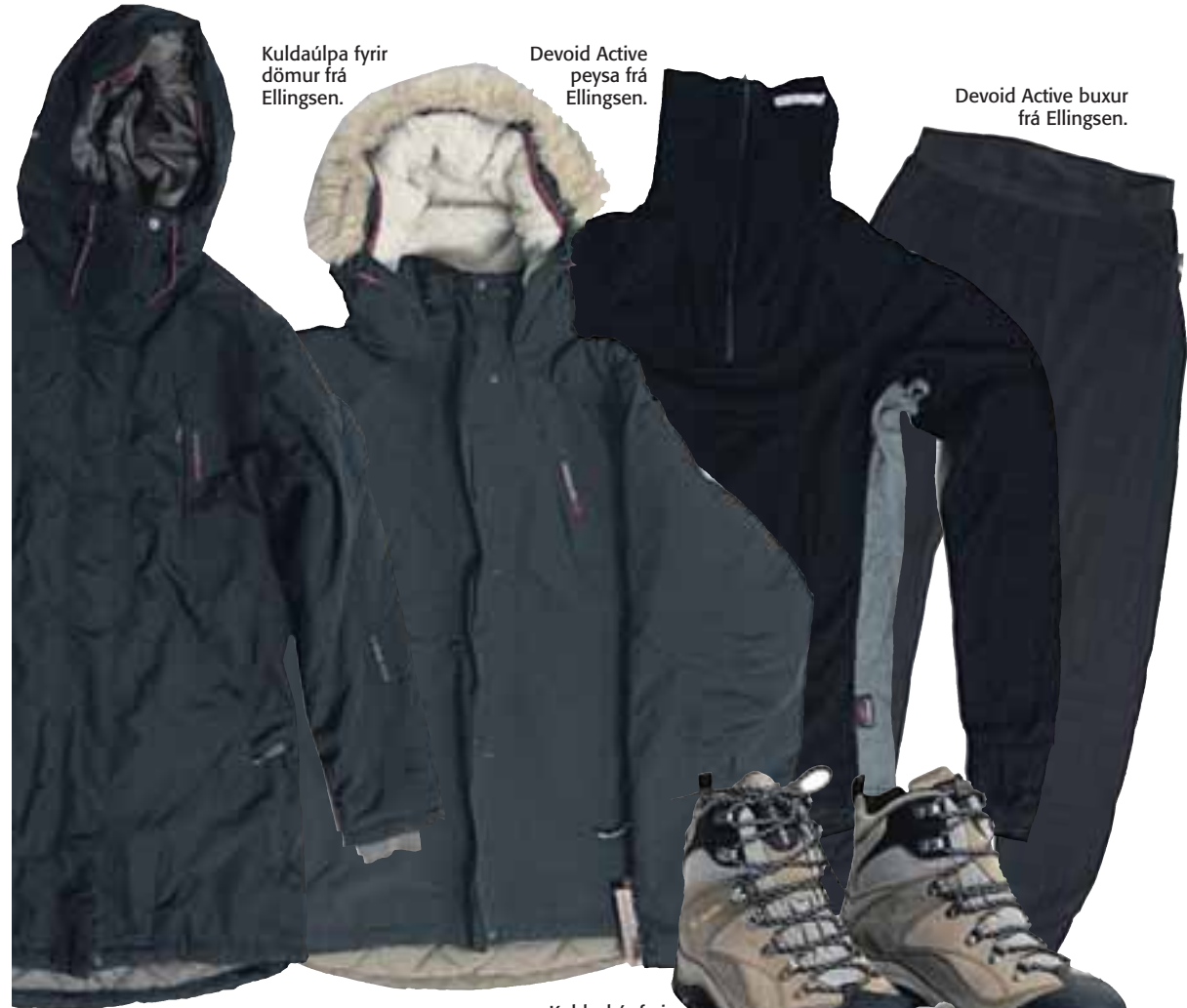
Kuldaúlpa fyrir dömur frá Ellingsen.

Egill Arnason hf. Ármúla 8 108 Reykjavík Sími: 595 0500