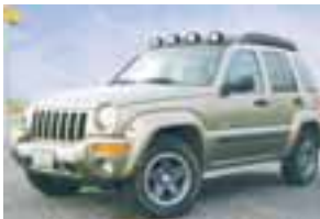
Bein fyrirtaka. Jeep, árg. '04. ek 30 þ. míl. Einn vel útbúinn. lán ca. 2.5 m. S. 662 6648