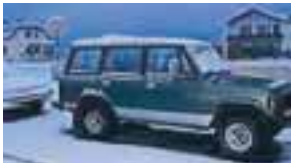
Gullmoli! Fyrsti bíllinn minn er til sölu. Góður og vel með farin pajero 2,6 ek.250.000 með grind og kösturum. Er á 32" nelgdum dekkjum. Skoðaður 07'á athugasemda + 32" microskorin dekkjagangur á flottum álfelgum. Tilboð óskast. 8674625