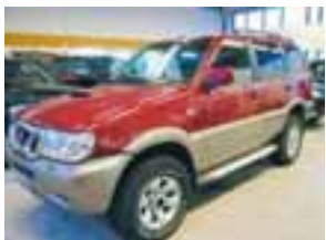
Nissan TERRANO II Luxury, árg. 2000, ek. 108 þús.km, DÍSEL, Verð 1690 þús. kr.

100 bílar ehf Funahöfða 1, 110 Reykjavík Sími: 517 9999 Opíð virka daga 10-19 og laugardaga 12-17 www.100bilar.is