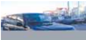
Nissan Patrol Elegans árg. '05 ek. 27 þús. km. Ssk., leður og luga, aðgerðarstýru, dráttarkr. 5 manna. Verð 4,290, ath skipti á ódyrari. Uppl. í s. 824 2884.

Heimsbílar Kletthálsi 2, 110 Reykjavík Sími: 567 4000 www.heimsbilar.is