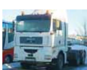
Til sölu MAN TGA 510. Árg. '03. Ek. 285þ. Ssk. Mjög góður bíll. Uppl. í s. 846 8564.