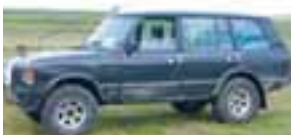
Range Rover LSEi Vogue 1993, 33" dekk TD5 vél og kassi ek. ca 100 þús. S. 866 3183.