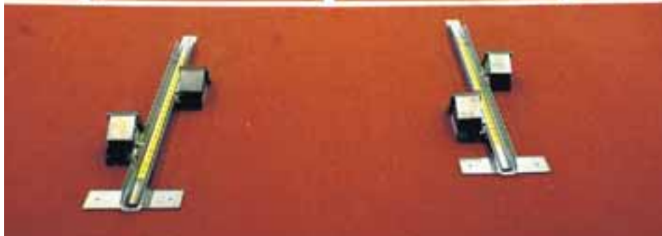
Ný aðstaða frjálsíþróttafólks í viðbyggingu Laugardalshallar hefur gjörbylt allri aðstöðu til frjálsíþróttaiðkunar.