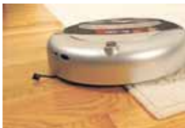
Ryksugan er hönnuð til að þrifa allar gerðir gólfplata, allt frá teppum til gólfduka.

Það hljómar sem nokkuð fjarlæg framtíðarsýn að vera með vélmanni á heimilinu sem hjálpar til við þrif. En þetta er þó alls ekki fjarri lagi.