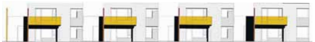
Hólatún er í Naustahverfi á Akureyri.

eru úr eik. Húsið er frágengið að utan, pússað og málað, stéttir steypar og plan malbikað. Lóð er þökulögð. Byggingarverktaki er Hyrna ehf. en söluaðili er fasteignasalan Hóll. Íbúðirnar verða tilbúnar í september 2007.