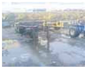
Floor gámagrind 3ja öxla á tvöföldu, 12 lásar, 2 lyfti öxlar O.K.Varahlutir S. 696 1050.