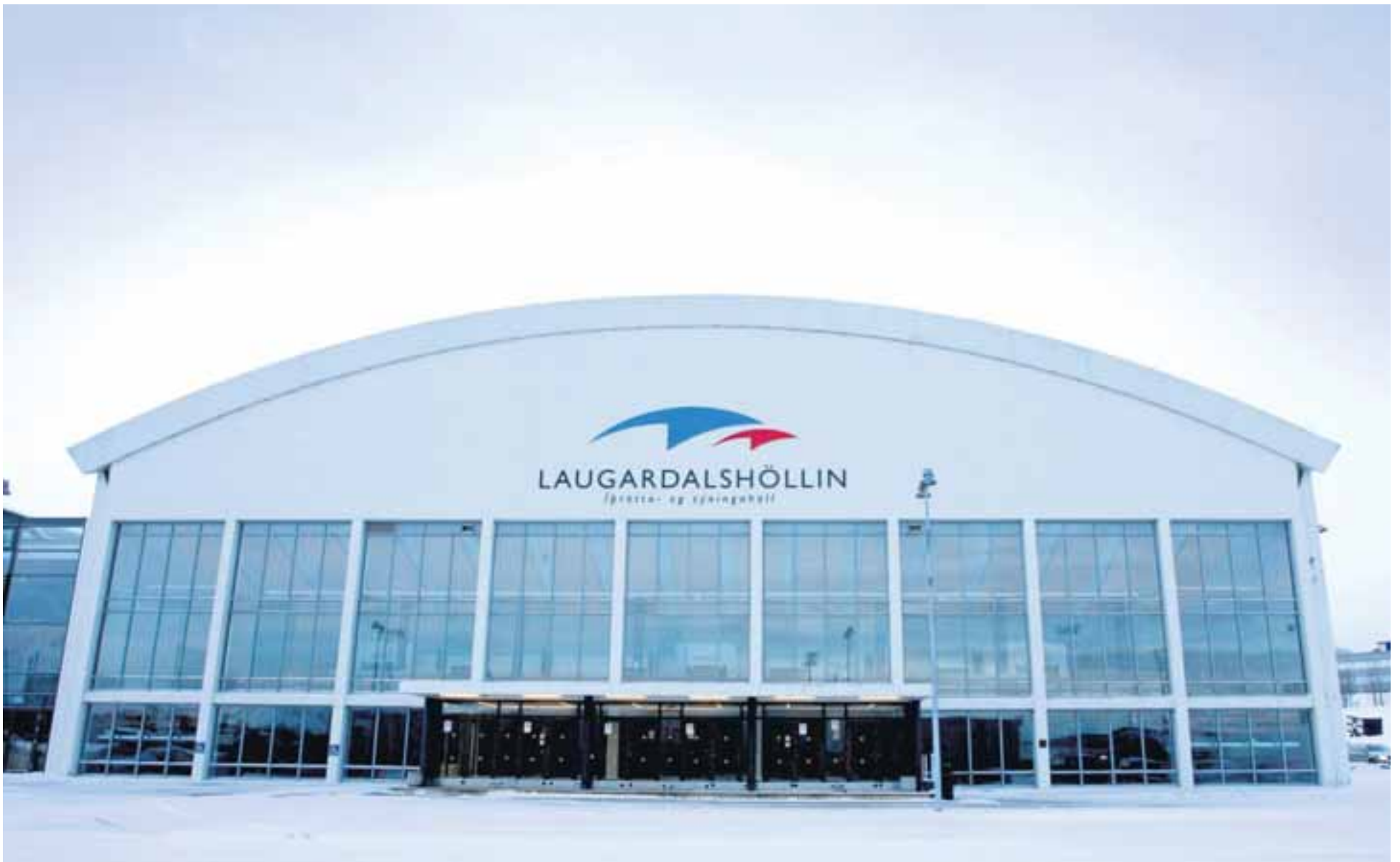
Laugardalshöllin var vígð árið 1965 og hefur allar götur síðan verið okkar helsta íþróttavígi.