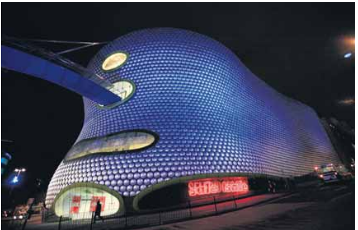
Verslunin stendur í verslunarhverfinu Bull Ring í útjaðri Birmingham.

SUMARHÚSALÓÐ VIÐ YTRI RAN-GÁ Sumarhúsaloð ásamt 15 fm gestahúsi í landi Svinhaga. Lóðin er 8,900 fm eignarlóð. Samþykktar hafa verið teikningar af 147 fm heilsárhúsi og púði er kominn. V. 7,9 m. 4985