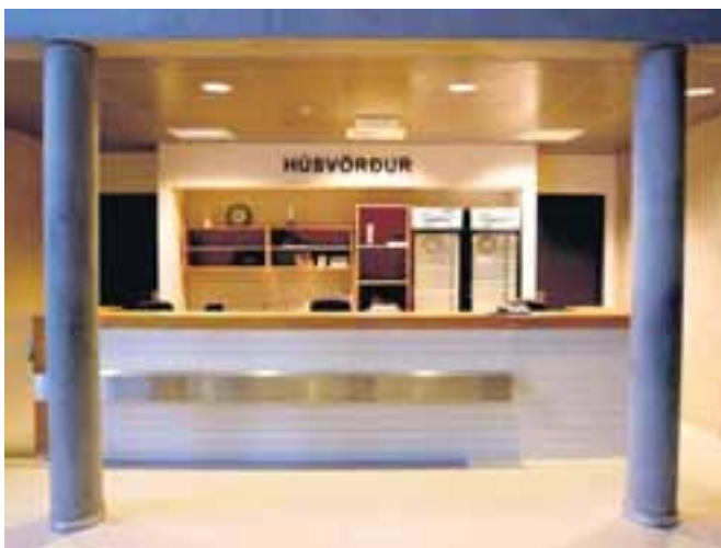
Ætli húsvörðurinn sé í boltaleik inni í húsi?