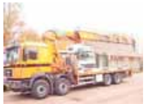
Man 37.403 1998 með 98tm Effer (2000) Glæsilegur bíll. Getum útv þennan bíl ásamt fl kranaþílum og vögnum. O.K.Varahlutir Kt. 450989 - 1779.