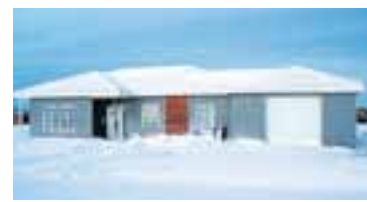
Tomoku-húsin virðast þola íslenska veðráttu.

að segja frá því að fyrsta svona húsið sem reis í Evrópu var á Hallormsstað,“ segir hann og bætir við að átta hús séu komin upp hér á landi og hafi reynst vel. „Eitt Tomokuhús er nýrrið hér á Hvammstanga, það er 250 fermetrar að stærð og uppsetning eininganna tók tvo daga. Meistararnum list afspyrnuvel á húsið og sagðist myndu leika sér að því að setja upp minna hús á einum degi.