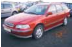
VOLVO V40 Nýskr: 07/1999, 1600cc 5 dyra, Fimmgir, Gulur, Ekinn 123.000 þ. Verð: 690.000

Bíland, B & L Grjótháls 1, 110 Rvk. Sími: 575 1230 www.bilaland.is