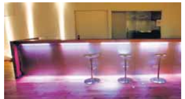
Laugardalshöllin er orðin að fjölnotahöll sem nýtt er ekki bara undir kappleiki heldur ráðstefnur, sýningar, veislur og ýmsa viðburði. Það er ástæða barsins, enda vita allir að íþróttir og áfengi fara illa saman.