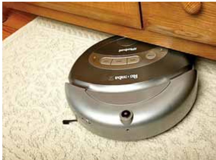
Roomba er lág og kemst undir flesta skápa og rúm.