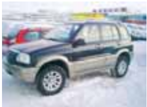
Suzuki Grand Vitara Limited. Árg 08/04. Ekinn 41 þús. Sjálfsk. Verð 2.390.000 kr.

Bílalind Vagnhöfði 9, 110 Reykjavík Sími: 580 8900 www.bilalind.is