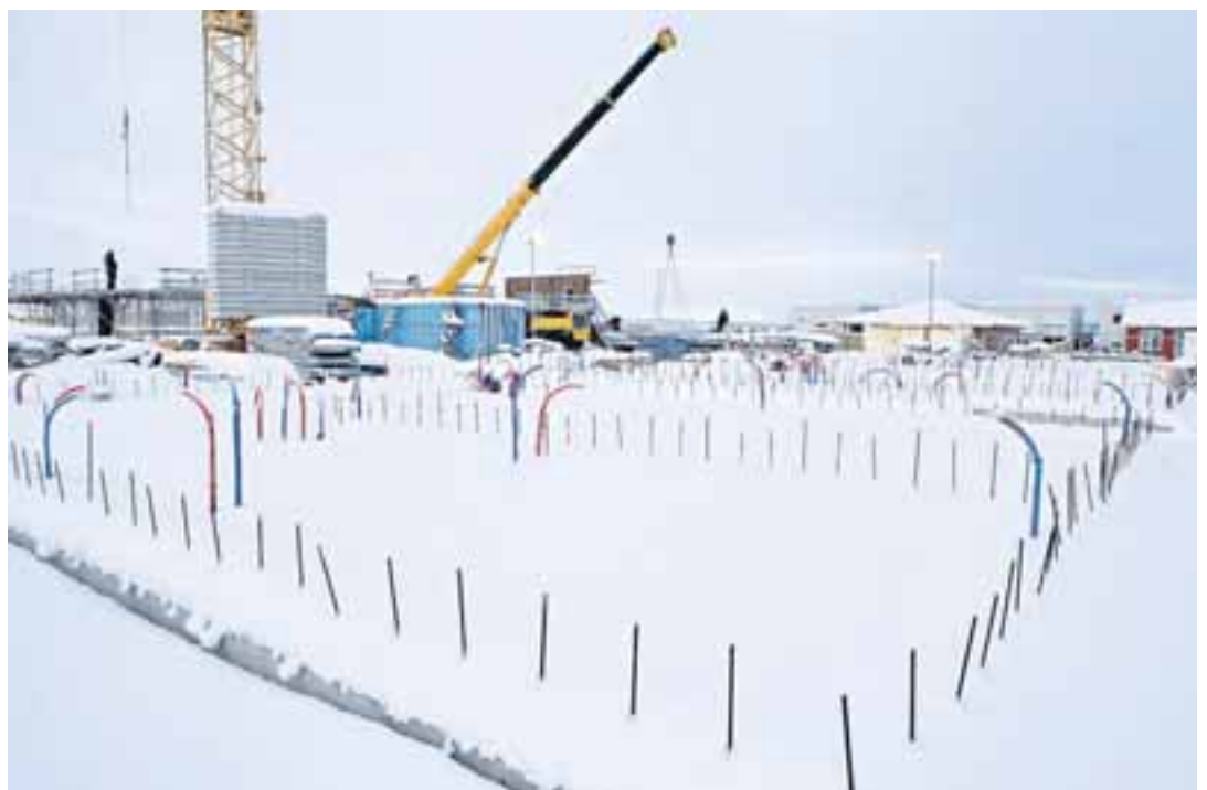
Íbúðirnar eins og þær líta út í dag en áætlað er að allt verði tilbúið í september.