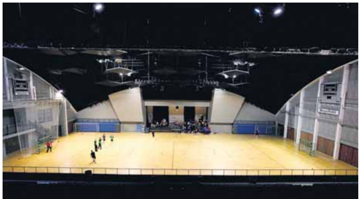
Landsliðið að undirbúa sig af fullum krafti fyrir heimsmeistaramótið í handknattleik sem nú fer fram í Þýskalandi.