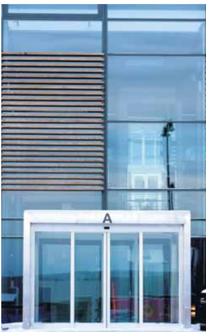
Munur á arkitektúr gömlu hallarinnar og nýju viðbyggingarinnar sýnir vel hve hratt byggingarlistin breytist.