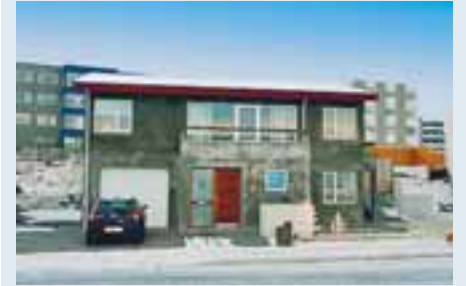
HOF fasteignasala er með til sölu glæsilegt einbýlishús á tveimur hæðum við Jónsgeisla í Grafarholti.