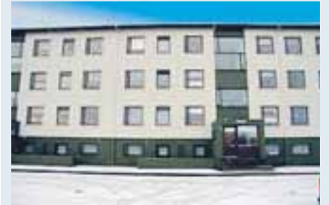
DRAUMAHÚS fasteignasala er með til sölu við Suðurbraut í Hafnarfirði fjögurra herbergja íbúð á 2. hæð