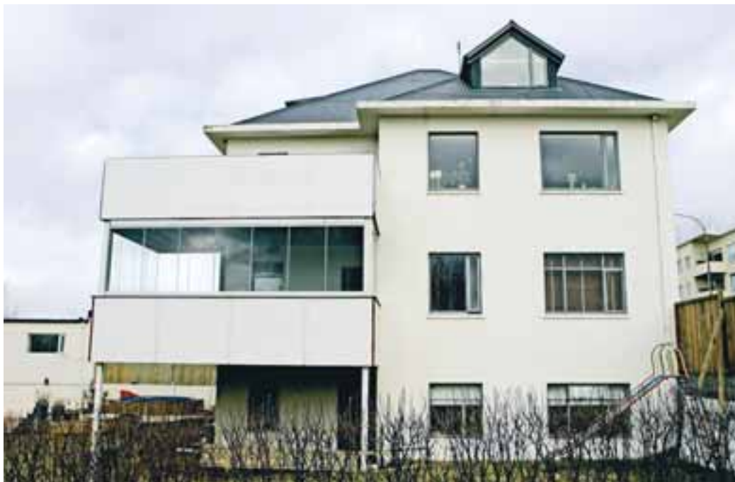
Húsið að Hringbraut 62 í Hafnarfirðinum er selt sem einbýlishús þó að það skiptist í tvær íbúðir.