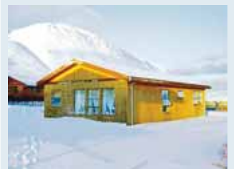
Ás fasteignasala er með til sölu við Álfabyggð í Súðavík einbýli á góðum stað.