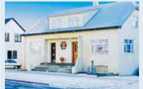
HÖFÐI fasteignasala er með til sölu parhús við Ægisíðu í Reykjavík.