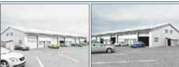
Gagnheiði 74, Selfossi Iðnaðarhúsnæði byggt úr galvaniseraðri stálgrind sem er sýnileg að innan. Einingarnar eru yfirlingar eða samlokueiningar(steinull). Endalíbúðin eru 82,2 fm. Verð 8,0 m.