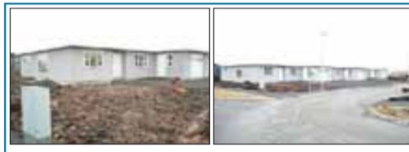
Graphólar 1, Selfossi Óvenju stórt og glæsilegt raðhús í Suðurbyggð á Selfossi. Staðsetningin er góð með tilliti til grunnskólans og væntanlegs leikskóla í hverfinu. Húsin eru hvert um sig um 191 fm í heild en þar af er bílskúr 35 fm. Íbúðin er því 156 fm. Verð 19,8 m.