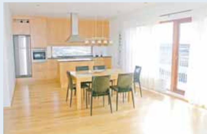
Eldhústæki frá AEG og rýmið opið og bjart.