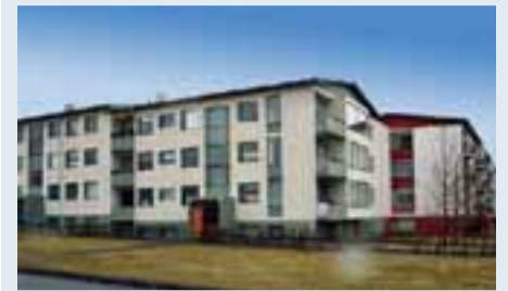
DOMUS fasteignasala er með til sölu 4ra herbergja íbúð ásamt aukaherbergi í kjallara í Hraunbæ