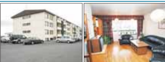
Háengi 6 íb. 104, Selfossi Í einkasölu snyrtilega 95,5 fm íbúð á tveimur hæðum ásamt 6,3 fm geymslu í kjallara. Verð 15,7 m.