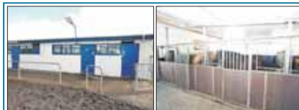
Suðurtröð 3, Selfossi Snyrtilegt 8 hesta hús í Suðurtröðinni. Innréttingarnar eru galvaniseraðar og með plastklæðningu. Kaffistofa og rúmgóð hlaða eru einnig í húsinu. Verð 4,4 m.