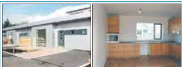
Grænamörk 2a, íbúð 104, Selfossi Um er að ræða glæsilega 81,5 fm. endalíbúð í nýju raðhúsi fyrir 50 ára og eldri. Verð 21,9 m.