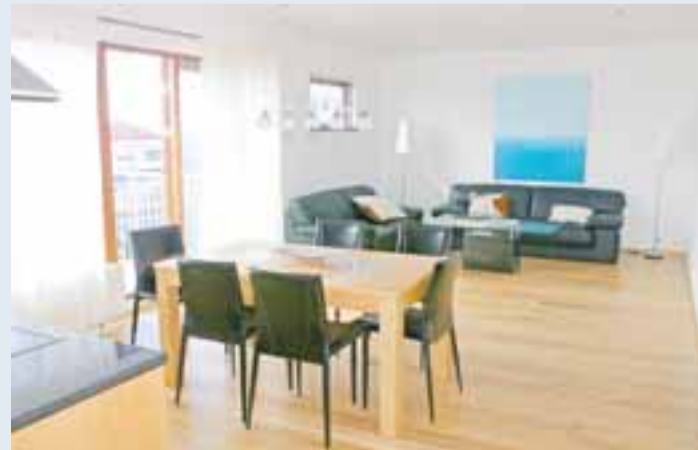
Kaupendur geta valið gólfefni sem fagmenn sjá um að leggja og er það innifalið í íbúðarverðinu.