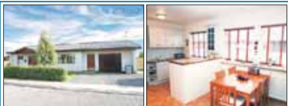
Sílatjörn 9, Selfossi Mjög snyrtilegt 122,5 fm einbýlishús ásamt 49,9 fm bílskúr. Húsið er byggt árið 1990. Verð 29,5 m.

Austurvegi 3, Selfossi | S: 480 2900 | Fax: 482 2801 | Félag fasteignasala