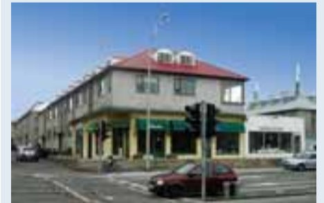
FASTEIGNIR & FYRIRTÆKI fasteignasala eru með til sölu vel staðsettar útleigugeininga við Miklubraut.