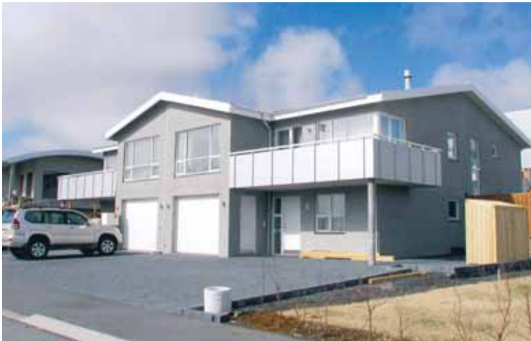
Húsið stendur í botnlangagötu á fjölskylduvænum stað í Salahverfi.