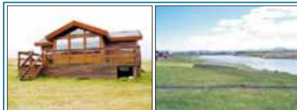
Rangárstígur 3, Rangárþing ytra. 42,2 fm. sumarhús sem stendur á 1.900 fm. eignalóð á bökkum Ytri-Rangár. Stutt er á Hellu og er bústaðurinn göngufæri frá Hellu. Verð 9,9 m.