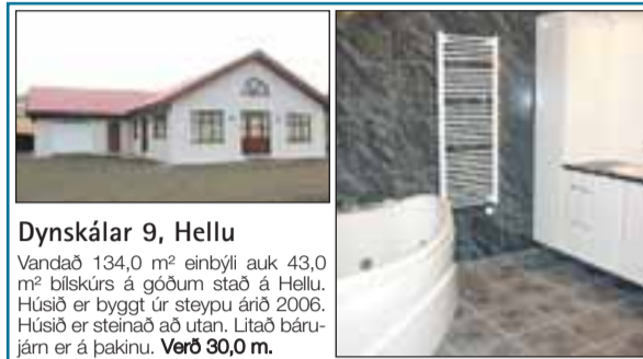
Dynskálar 9, Hellu Vandað 134,0 m² einbýli auk 43,0 m² bílskúrs á góðum stað á Hellu. Húsið er byggt úr steypu árið 2006. Húsið er steinað að utan. Litað bárujárn er á þakinu. Verð 30,0 m.