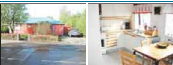
Engjavegur 8, Selfossi Um er að ræða 113,0 fm einbýlishús ásamt 38,3 fm bílskúr. Verð 22,7 m.