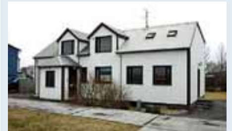
DRAUMAHÚS fasteignasala er með til sölu parhús í Skerjafirði