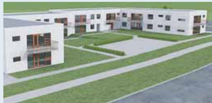
Húsin við Tjarnarbakka 4-8 eru hönnuð í U-form, sem gerir það að verkum að mjög gott skjól myndast í garðinum sem snýr í suður. Í hverja íbúð er sérinnangangur en bílskúrar eru átta og seldir til þeirra sem þess óska. Bílastæði eru malbikuð, stígar verða hellulagðir eða steypfir. Lóð tyrfoð og fullfrágengin, sorggeymslur steypfir og málaðar.

í bragði. Hann bætir því við að búseta í minna bæjarfélagi bjóði upp á marga kosti umfram þá að hafa búsetu í Reykjavík. „Hér er líka allt til alls en bara styttra í allar áttir. Við förum reyndar í bæinn svona einu sinni til tvisvar í viku, til að heimsækja ættingja og annað, en það tekur ekki langan tíma heldur. Og eftir að búúið verður að tvöfalda Reykjanesbrautina þá tekur kannski ekki nema korter að keyra í Smáralindina,“ segir þessi sátti Keflvíkingur að lokum. -mhg