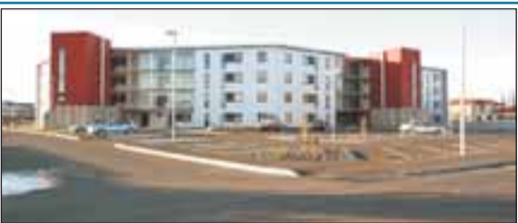
Grænamörk 2, íbúð 205, Selfossi Glæsileg 73,0 fm. íbúð á 2.hæð nýju fjölbýlishúsi fyrir 50 ára og eldri. Þar af er 6,0 fm geymsla í kjallara. Verð 19,0 m.