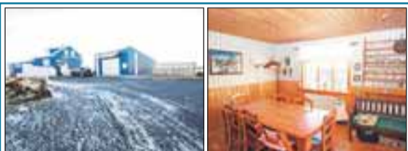
Eyrarbraut 9, Stokkseyri Einbýlishús, kjallari hæð og ris ásamt 59,6 fm bílskúr. Húsið var byggt árið 1910 en hefur verið mikið endurnýjað. Bílskúrin er byggður 2004. Verð 32,0 m.