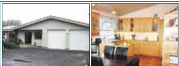
Spóarimi 23, Selfossi 239,2 fm einbýlishús þar af er bílskúr 53,8 fm. Húsið er klætt að utan með steni og er bárujárn á þaki. Verð 36,0 m.