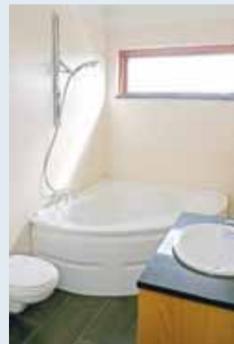
Baðherbergi flísalagt í hólf og gólf.

Gert er ráð fyrir halogenlýsingu víða í íbúðunum en ljósakúpull fylgir í eldhúsi, baðherbergi, þvottahúsi og geymslu. -mhg