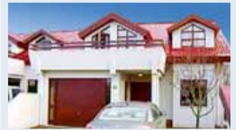
LYNGVÍK fasteignasala er með til sölu endaraðhús á tveimur hæðum með innbyggðum við Sæbólsbraut í Kópavogi.