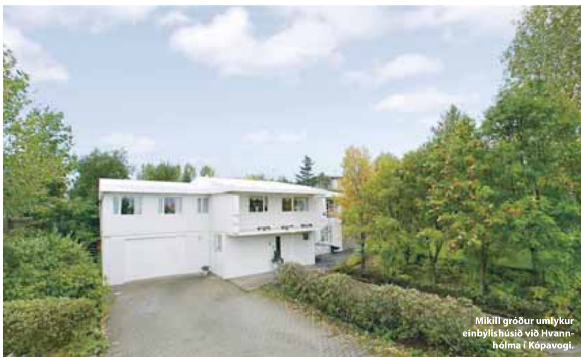
Mikill gróður umlykur einbýlishúsið við Hvannhólma í Kópavogi.

RE/MAX Fasteignir Engjateig 9 105 Reykjavík Sími: 578 8800