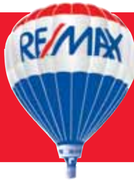
Bragi Valgeirsson sölufulltrúi