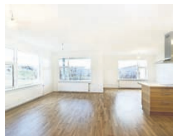
Íbúðirnar eru með fallegu eikarparketi.