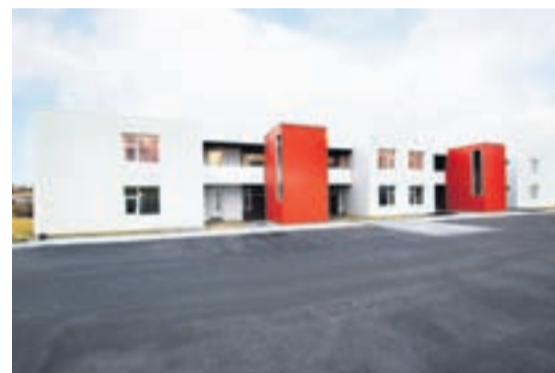
Fjórtán íbúðir eru í húsinu sem er klætt viðhaldslítilli klæðningu.

Eldhúsið er til hlíðar við stofuna með góðum skápavegg, Fyrir framan eldhúsið er gert ráð fyrir bjartri borðstofu. Íbúðin er afhent með fallegu eikarparketi á gólfum en gólf anddyris, bað- og þvottaherbergja eru flísalögð og er hiti í gólfum þar sem flísar eru. Fallegar eikarinnréttingar og innihurðir í stíl. Gert er ráð fyrir ríkulegri lýsingu í loftum aðalrýmis íbúðarinnar.