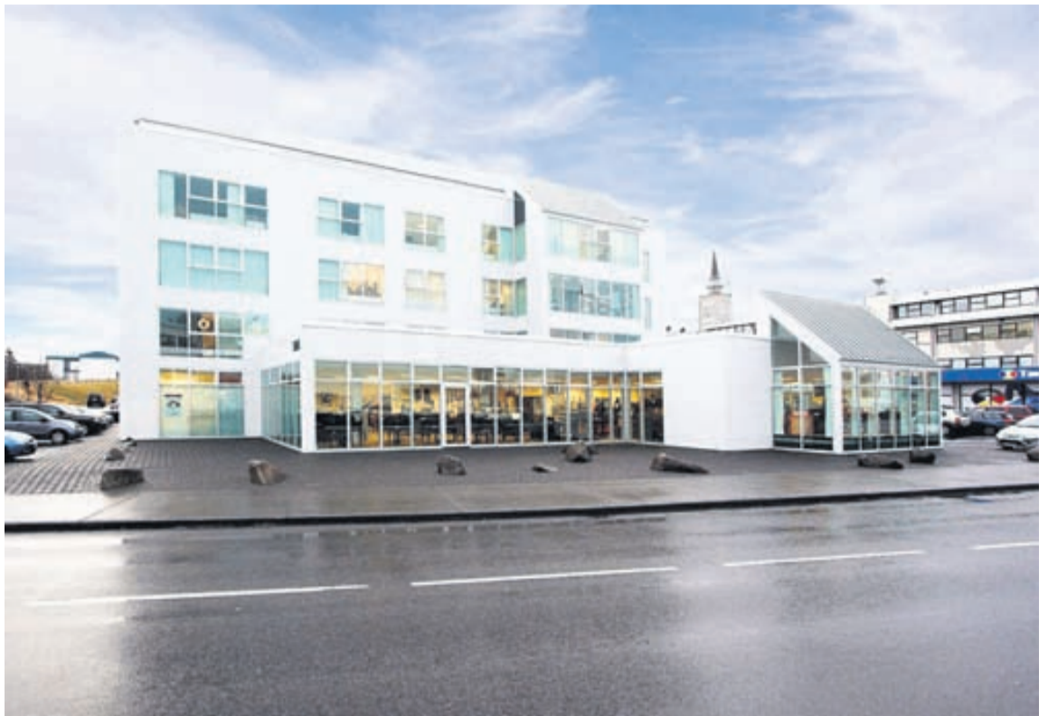
Húsnæðið er 675 fermetrar að stærð og einkar glæsilegt.

Valhöll fasteignasala • Siðumúla 27 • Sími:588-4477.