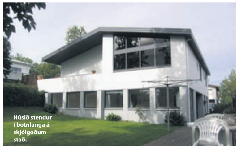
Húsið stendur í botnlanga á skjólgóðum stað.

Komið er inn í flísalagða forstofu með fatahengi. Úr forstofu er einnig inngangur í íbúðina á neðri hæðinni. Inni af forstofu er þvottahús. Teppalagður stigi liggur upp á efri hæðina. Þar eru öll loft tekin upp og því mikil lofthæð. Stórt hálfopið eldhús er með flísalögðu gólfi og fallegri innréttingu. Eldhús er skilið frá stofu að hluta með arni. Stofa er parkettlögð með útgang út í sólstofuna. Vinnuhol með parketti á gólfi. Svefnherbergisgangur er parkettlagður. Hjónaherbergið