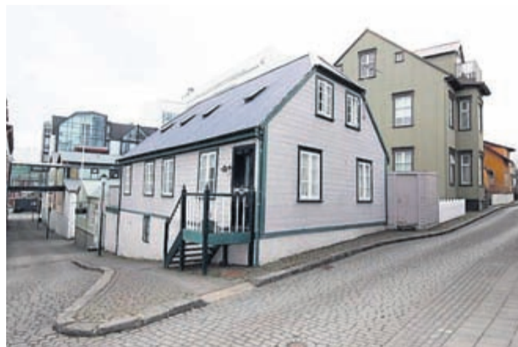
Fischersund 3 var byggt árið 1874, en var mikið endurnýjað upp úr 1995.