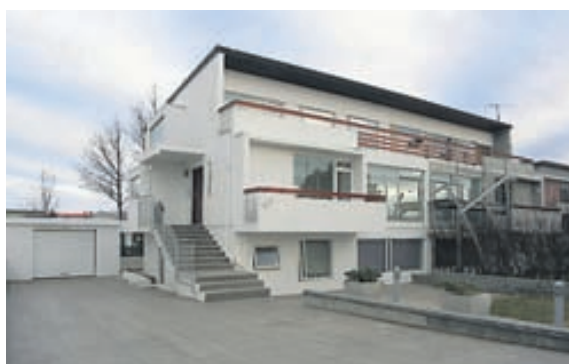
Tvennar svalir snúa mót suðri, aðrar sérstaklega stórar.