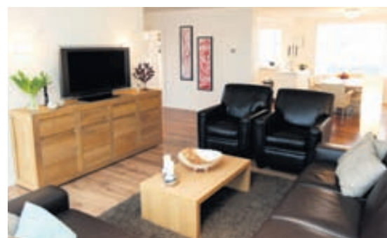
Fallegt eikarparket er á gólfum aðalíbúðar og opið milli stofu, borðstofu og eldhúss.