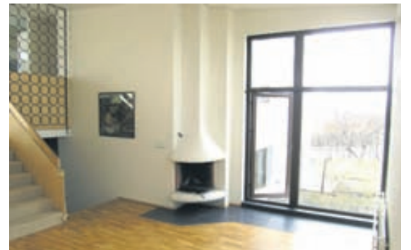
Fallegur arinn er í stofunni.

Komið er upp á efsta pallinn úr stofunni. Þar er rúmgóð parketlögð borðstofa. Eldhús með flísum og fallegri innréttingu, hvít og úr eik. Sólskáli tengir á skemmtilegan hátt saman borðstofuna og eldhúsið. Á svefnherbergisgangi er hjónaherbergi með parketi, tvö herbergi með parketi og skápum, stórt baðherbergi flísalagt í hól og gólf, sturta og stórt nuddbaðkar.