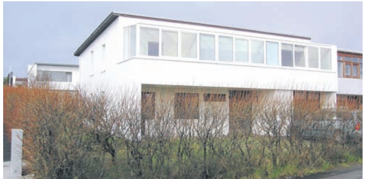
Húsið er mikið endurnýjað bæði að innan og utan.

Ingólfur Gissurarson lgf. Valhöll fasteignasala • Síðumúla 27 • Sími:588-4477.