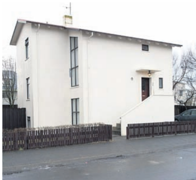
Húsið stendur á gróinni lóð í Vesturbænum.

baðherbergi með sturtu og tengi fyrir þvottavél. Eldhús er með hvítri eldri innréttingu. Stofan/herbergið er parketlögð.