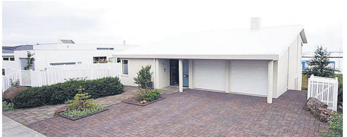
Húsið er með 40 fermetra bílskúr og staðsett neðst í Ásahverfinu.