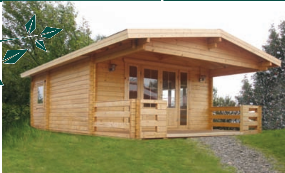
70 mm bjálki / Tvöföld nótn