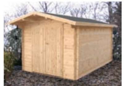
34 mm bjálki / Tvöföld nótn

kr. 139.900,- án fylgihluta kr. 159.900,- m/fylgihlutum