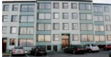
Kjarrhólmi - auðveld kaup 90 fm 4ra herb íbúð á þriðju hæð. Íbúðin er parketlögð nema bað er flísalagt. Svefnherbergi rúmgóð. Þvottah. í íbúð. Fæst á yfirtöku lána + sölulaun. Gbr. 81 pr mán.