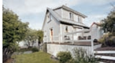
Nönnustígur 14 - einbýli Einstaklega fallegt og sjarmerandi einbýlishús í hjarta Hafnarfjarðarbæjar. Húsið er steypt, með bárujárnsklæðningu og hefur verið mikið endurnýjað á smekklegan hátt Verð 38 millj.