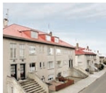
Barmahlíð - 2ja - 3ja herb Góð 2ja - 3ja herbergja mikið endurnýjaða íbúð í kjallara með sérinngang.Íbúðin hefur öll verið endurnýjuð m.a. gólfefni, baðherbergi o.í.l. Fæst á yfirtöku + sölulaun. Verð 23,2 millj.