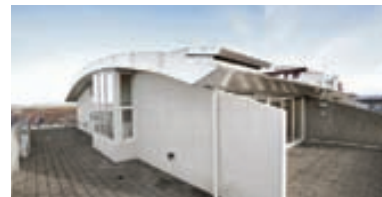
Rjúpnasalir - penthouse Glæsilega penthouse íbúð á 12. hæð með 110 fm svölum umhverfis íbúðina. Íbúðin skiptist í hol, stofu, eldhús, baðherbergi, tvö svefnherbergi og þvottahús. Sórt stæði í bilageymslu fylgir. Nánari uppl. á skrifst.