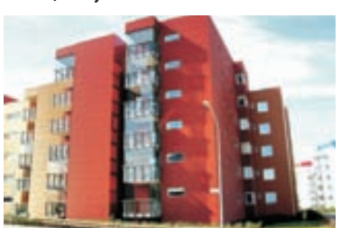
Sóltún - 3ja herb 136,7 fermetra 3ja herbergja íbúð ásamt stæði í bilageymslu við Sóltún í Reykjavík. Eignin skiptist í forstofu hol, stóra stofa, eldhús, þvottahús, baðherbergi, hjónaherbergi, svefnherbergi. Verð 37,5