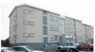
Arnarsmári - 4ra herb. Góð 4ra herbergja íbúð við Arnarsmáran í Kópavogi. Parket og flísar á gólfum. Verð. 23 millj