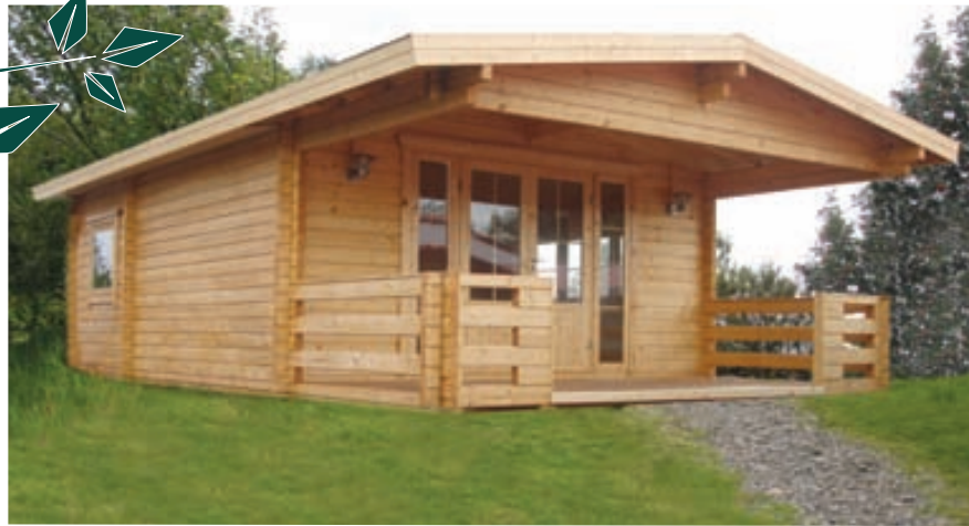
70 mm bjálki / Tvöföld nótun

25.000 kr. lækkun á öllum GARÐHÚSUM. Allt á að seljast, fyrstur kemur fyrstur fær.