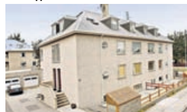
Barmahlíð - hæð 167 fm mikið endurnýjaða hæð, þar af tvö herbergi í kjallara og 31,5 fm bílskúr. Hæðin skiptist í þrjú svefnherbergi, baðherbergi, stofu og eldhús. Glæsileg eign. Verð 38 millj.