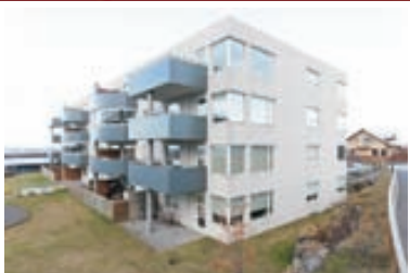
Hlynsalir - 3ja herb Gullfalle og vönduð 3ja herb. 102,7 fm. íbúð með sérinngangi frá yfirbyggðum svalgangi og stórra afgirtri verönd í verðlaunablokk í Salahverfinu. Sérstæði í bilageymslu. Verð 23,5 millj.