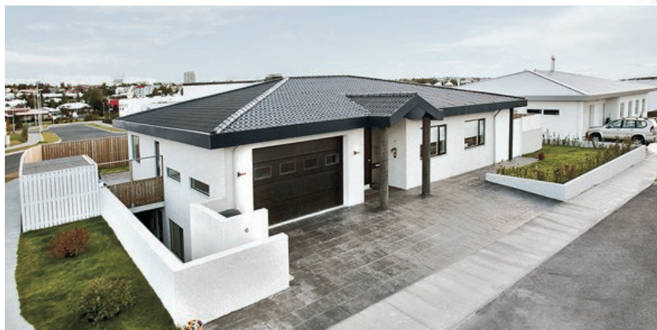
Hvannakur - einbýli Fallegt og vel skipulagt 299,3 fm. einbýlishús á tveimur hæðum og stendur á hornlóð í Akrahverfinu í Garðabæ. Sér íbúð er á neðri hæð húsinns með sér inngang (möguleiki að opna á milli)