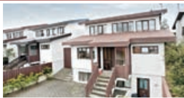
Hryggjasel - einbýli Notalegt 2ja íbúða einbýli/tengihús ásamt tvöföldum bílskúr á rólegum stað. Aðalíbúðin er 169,6fm. Íbúðin í kjallara er 60,5fm og bílskúrin er tvöföldur, 54,6fm. Samtals 284,7fm Verð 49,9 millj