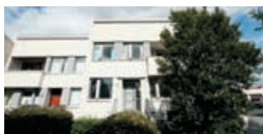
Fagríhvammur - einbýli Glæsilegt 481 fermetra einbýli þar af 106,4 fermetra íbúð á jarðhæð. Eignin skiptist í forstofu, gestasalerni, miðrymi, stofa, borðstofa, eldhús, þvottahús, bílskúr. Á annarri hæð er miðrymi, þrjú barnaherbergi, hjónaherbergi, baðherbergi. Íbúð á jarðhæð er 3ja herb. Nánari uppl. á skrifst. Verð 79 millj.