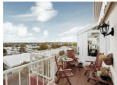
Ruðhamrar - útsýnisíbúð Stór og björt útsýnisíbúð á tveimur hæðum, ásamt bílskúr, samtals 198,2 fm., í grónu hverfi. Opið eldhús, stórar stofur og aukin lofthæð. Góðar suðursvalir. Mikið endurnýjuð íbúð. Fallegar innréttingar. Skipti möguleg á minni eign. Verð 38,9m.