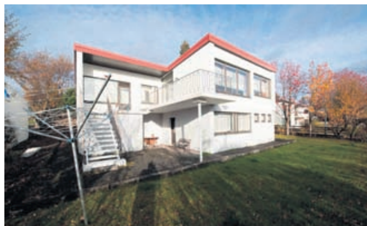
Húsið er nýlega klætt að utan með múrklæðningu.

Komið er inn í húsið á efri hæð í flísalagða forstofu með fataskápum. Inn af forstofu er gestasalerni og einnig parketlagt herbergi með fataskápum. Hol er parketlagt og rúmgott. Svefngangur er parketlagður og með skápum. Tvö barnaherbergi. Hjónaherbergi er með skápum á heilum vegg og með útgangi á stórar flísalagðar svalir til suðurs þaðan sem stigi er niður á lóð. Baðherbergið sem er nýlega endurnýjað með glugga og er flísalagt í gólf og vegg. Gólfsturta og handklæðaofn eru í baðherbergi. Úr holi er gengið tvö þrep upp í samliggjandi bjartar og rúmgóðar parketlagðar stofur með fallegu útsýni til suðurs og útgangi á stórar flísalagðar svalir. Fallegur arinn er í stofum.