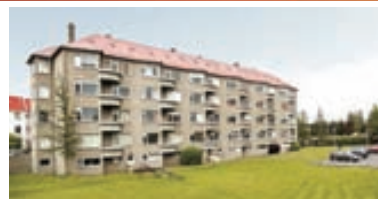
Hringbraut - 3ja herb 93,2 fm íbúð á 3. hæð. Snýrtileg íbúð með parketi á gólf. Auka herbergi með aðgangi að salerni er í risi. Geymsla og sameiginl. þvottahús í kjallara. Verð 21,9 millj.