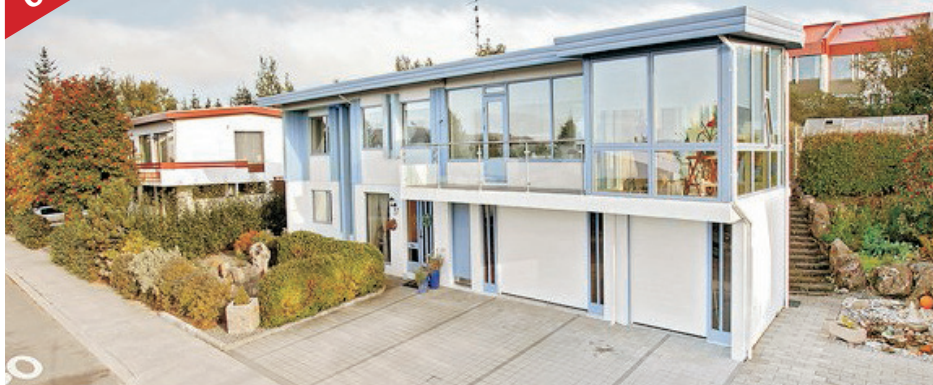
Akrasel - einbýli 275,2 fm tvílyft einbýlishús með 40,7 fm bílskúr við Akrasel í Breiðholti ásamt aukaíbúð. Húsið hefur alla tíð fengið gott viðhald. Aukarymi er í húsinu upp á ca. 55 fm. Opið hús mánudaginn 8. nóv. milli kl. 18:00 - 18:30