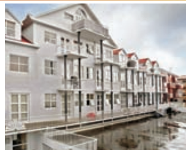
Hringbraut - 2ja herb. Gullfalle, mikið endurnýjuð og vel skipulögð 2ja herb. íbúð með góðum svölum á frábærum stað í lyftubokk með stæði í bílarkjallara. Góð sameign. Stutt í alla þjónustu. Nánari uppl. á skrifst