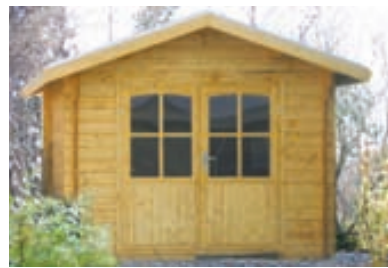
34 mm bjálki / Tvöföld nótun