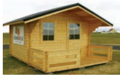
44 mm bjálki / Tvöföld nótun / Tvöfalt gler