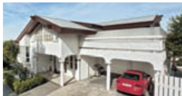
Fagríhvammur - einbýli Glæsilegt 481 fermetra einbýli þar af 106,4 fermetra íbúð á jarðhæð. Eignin skiptist í forstofu, gestasalerni, miðrymi, stofa, borðstofa, eldhús, þvottahús, bílskúr. Á annarri hæð er miðrymi, þrjú barnaherbergi, hjónaherbergi, baðherbergi. Íbúð á jarðhæð er 3ja herb. Nánari uppl. á skrifst. Verð 79 millj.