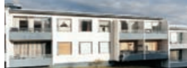
Efstíhjálli - 2ja herb. Vel skipulögð og góð 2ja herb. 56,8 fm. íbúð á 2. hæð í tveggja hæða fjölbýlishúsi, með góðum suðursvölum. Snýrtileg sameign og gróid umhverfi Verð 13,9 millj.