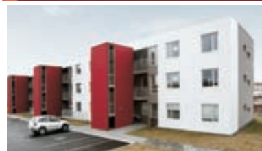
Línakur - 4ra herb 122 fm íbúð á útsýnisstað á Arnarneshæð. Parket á gólfum nema baði og þvottah. sem er í íbúði. Sér inngangur. Suðursvalir. Verð 29,5 millj.