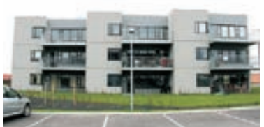
Gullengi - 4ra herb 132,1 fermetra 5 herbergja íbúð við Gullengi í Grafarvogi. Íbúðin skiptist í forstofu, sjónvarpshol, fjögur svefnherbergi, baðherbergi, baðherbergi, stofa og eldhús. Sérgeymsla í sameign. Nánari uppl á skrifst.