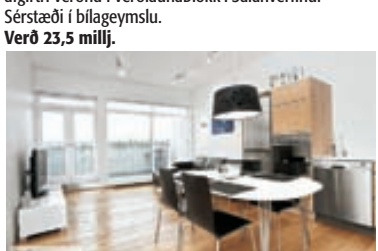
Reiðvað - 3ja herb Afar smekklega 3ja herbergja íbúð á efstu hæð með sérinngang og sér stæði í bilgeymslu. Stórar og góðar svalir eru við íbúðina. Lofthæð er frá 3.50 - 3.70m. Verð 21,9 millj.