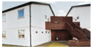
Holtabyggð - 4ra herb 99,1 fm 4ra herb. íbúð á 2.hæð í fjórþýli með sérinngang. Mjög gott útsýni er úr íbúðinni og afar falleg hraun lóð er við húsið. Skipti koma til greina á rað - parhúsi í Reykjavík. Verð 23,7 millj.