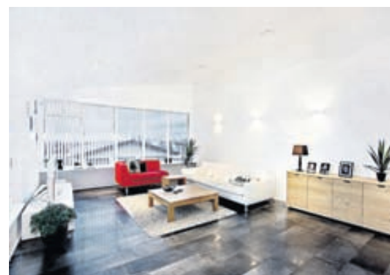
Stofan er björt og falleg. Strimlagardínur hanga fyrir velflestum gluggum hússins.