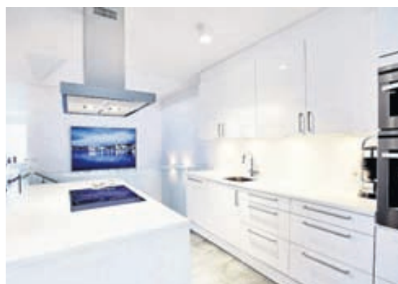
Öll eldhústæki eru frá AEG. Tveir ofnar eru í innréttingunni, sem er hvítspautulökkuð.