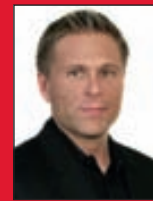
Þorsteinn Sölufulltrúi S: 694 4700