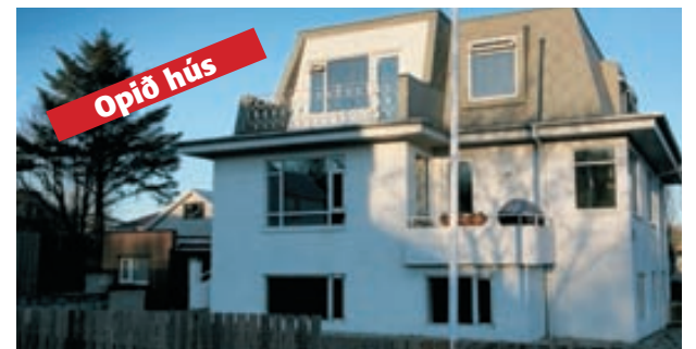
Ólafur Finnbogason sölufulltrúi