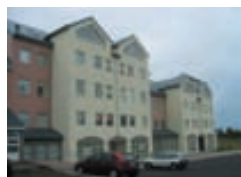
Pverholt 15, Mos.