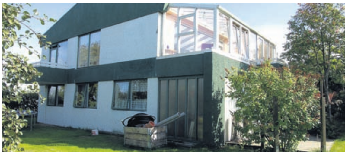
Húsinu fylgir fallegur bílskúr og garður.