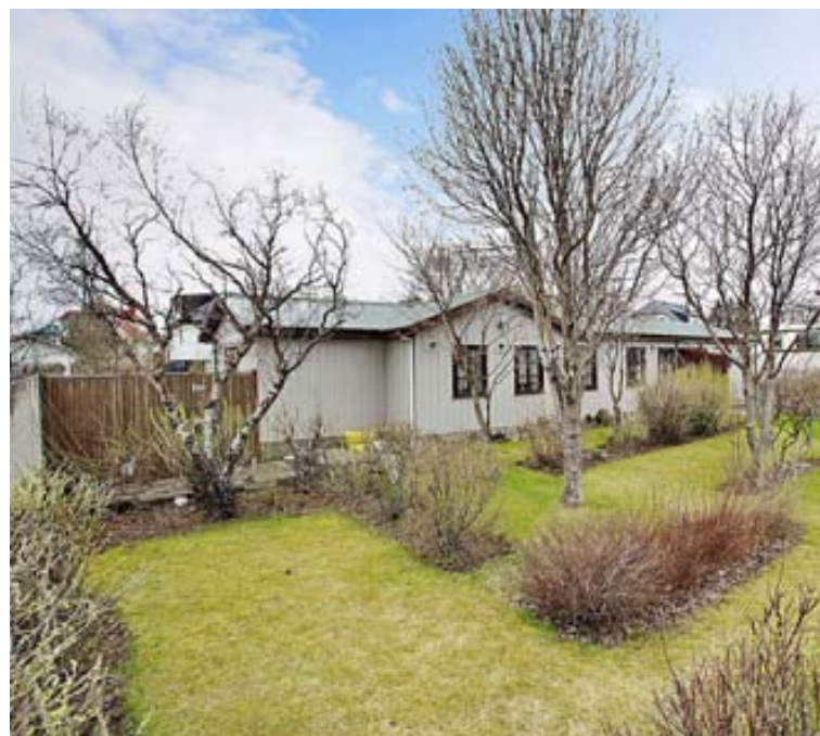
Húsið og umhverfi þess eru vitnisburður um byggð fyrir tíma skipulags.

Stofan er parketlögð. Einnig hjónaherbergi sem er með stórum nýlegum eikarfataskáp og tvöfaldri hurð út á afgirta verönd til suðurs. Einnig eru tvö parketlögð