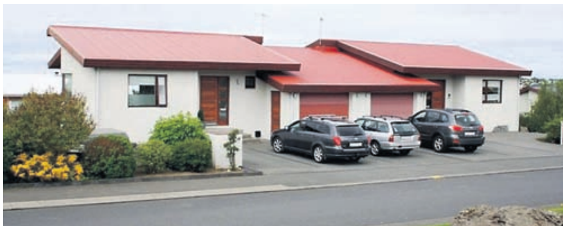
Húsinu fylgir bílskúr og garður í góðri rækt.