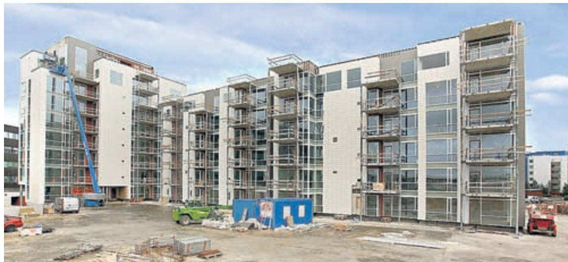
Vel hefur gengið að selja íbúðir í Mánatúni.