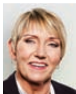
Guðrún Pétursdóttir skjalagerð