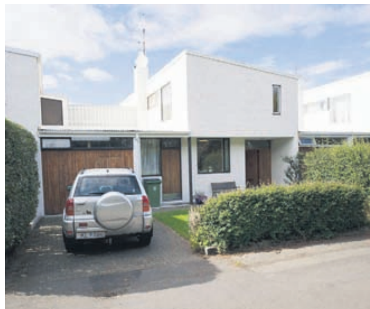
Húsinu fylgir falleg lóð og verönd til suðurs.

Stofan er björt, parkettlögð og með útgangi á skjólgöða víðarverönd til suðurs. Borðstofa er björt og parkettlögð.