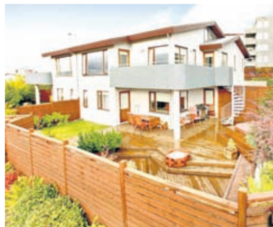
Glæsilegur garður með pöllum umlykur húsið.

Borðstofa er opin yfir í stofuna. Borðstofan er stór og rúmar vel stórt borðstofuborð. Stofan blasir við þegar komið er inn í eignina frá forstofu og er opið að hluta yfir í hana bæði frá eldhúsi og borðstofu. Glæsilegt útsýni er frá stofunni yfir Kópavog, niður Hnóðraholt, yfir í Garðabæ og út á sjó. Útgengi er á svalir með glæsilegu útsýni út frá stofunni.