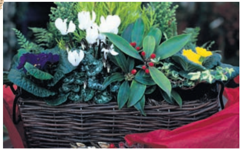
Hafir þú fengið stóra jólagjafakörfu er gott að geyma hana fram á vor og planta í hana sumarblómum. Þá er komið fyrir taksskraut á pallinn. Slíkar körfur má líka nota undir hvers kyns pottablóm innandyrna.