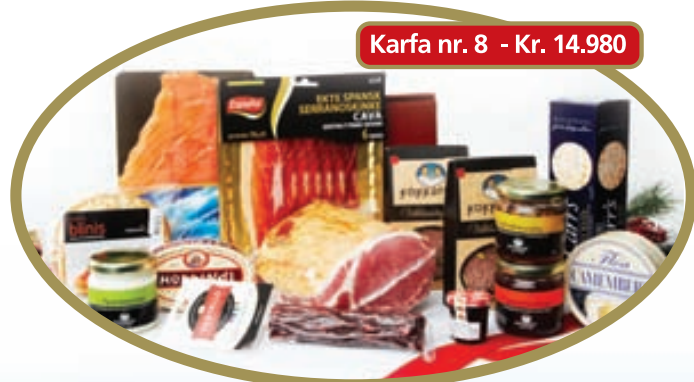
Karfa nr. 8 - Kr. 14.980

Villibráðarpaté, Cumberlandsósa, Camembert, valhnetuhunang, kex