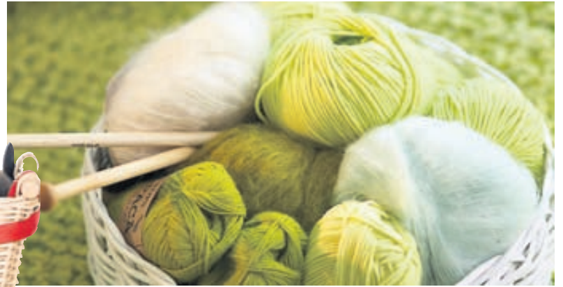
Garnið fer vel í bastkörfu og er algengt að stilla henni upp til hliðar við sófann. Þá geyma margir tímarit og dagblöð í gömlum gjafakörfum.