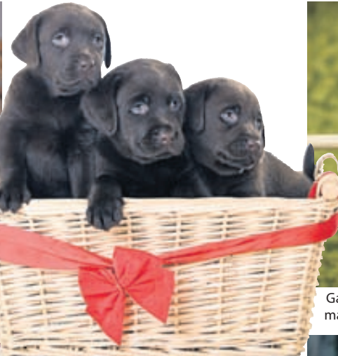
Gjafakarfa af stærri gerðinni getur síðar orðið gríðastaður dýranna.