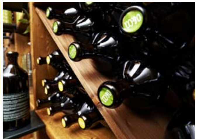
Tökum á móti veisluþöntunum í síma 562 2772