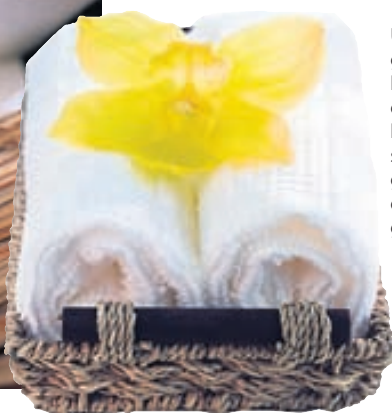
Upprúlluð gestahandklæði fara vel ofan í bastkörfu sem eitt sinn geymdu gúmmelaði eða fallega gjöf.