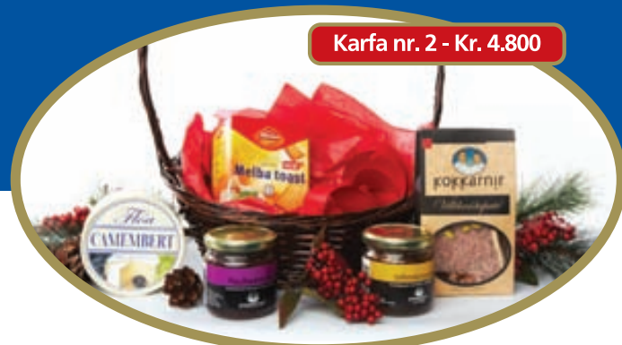
Karfa nr. 2 - Kr. 4.800

Mikið úrval af sælkeragjafakörfum til að gleðja viðskiptavini og starfsfólk. Körfurnar koma fallega innpakkaðar í sellófani með slaufu. Hafðu samband í síma 511 4466 eða skoðuðu heimasíðuna www.kokkarnir.is og fáðu upplýsingar um verð og hvaða körfur henta þér.