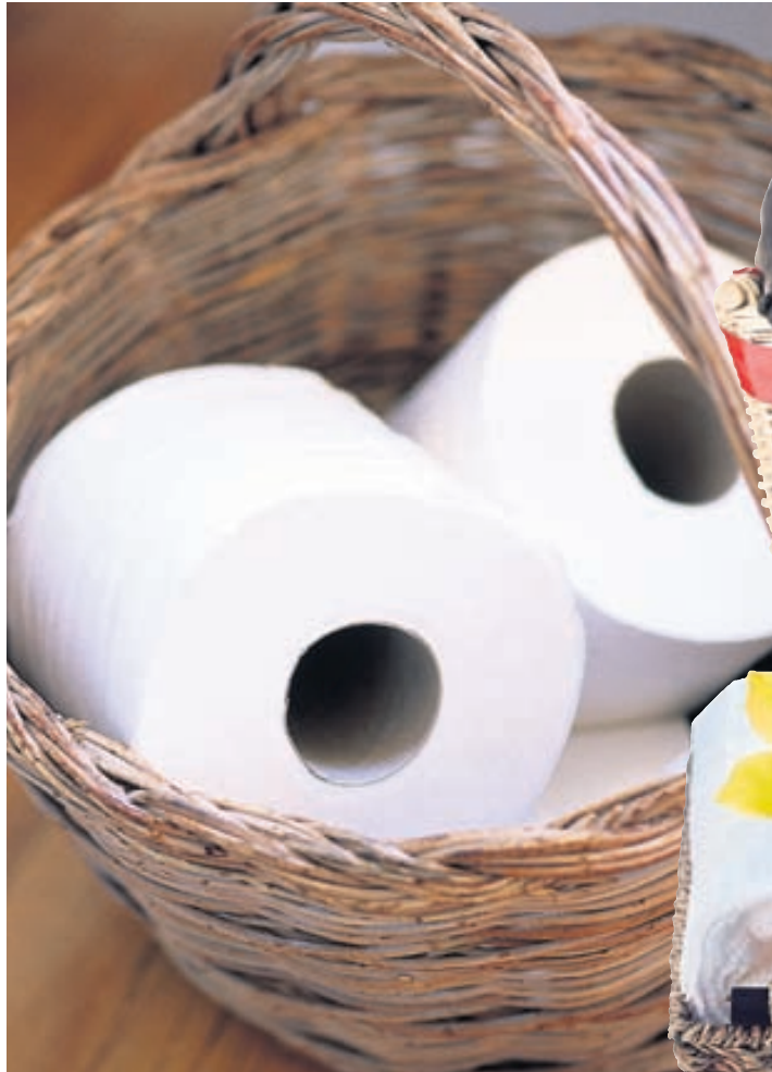
Gjafakarfa er tilvalin hirsla undir klósettrúllur.

Gjafakörfur, hvers kyns sem þær eru, gleðja og það er gaman að tína úr þeim góðgætið og njóta. Þegar karfan er orðin tóm er hægt að nýta hana á ýmsan veg, sérstaklega ef hún er stór og stæðileg. Hér eru nokkrar tillögur að því hvernig hægt er að lengja líftíma gjafarinnar.