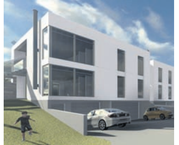
Íbúðirnar eru 185-205 fm, hjónaherbergi er með sérbaðherbergi.

Íbúðirnar eru einangraðar og þússaðar að innan, veggir og loft sandspörsluð og gólf vélslípuð. Veggir í kringum bað eru úr rakaþolnu gipsi en aðrir léttir veggir úr tvöföldu venjulegu gipsi. Hitakerfi er blanda af hefðbundnu ofnakerfi og hita í gólfi. Inntök vatns og rafmagns eru í inntaksrými í kjallara. Hitakerfi er lokað kerfi, heitt neysluvatn er á forhitara. Allir veggir eru fullmálaðir í ljósum lit. Lagt er fyrir sjónvarp og síma í hverju herbergi, ísteyptar dósir fyrir halógenlýsingu á ýmsum stöðum. Gólf verða flotuð tilbúin undir gólfefni. Vandaðar innréttingar, eldhúsinrétting og fataskápar ná upp í loft. Baðherbergin og þvottahúsið verða flísalögð, skolvaskur í borði í þvottahúsi. Fataskápar eru í öllum herbergjum og forstofu og ná upp í loft. Lofthæð innan íbúða