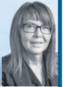
Íris Hall Löggiltur Fasteignasali