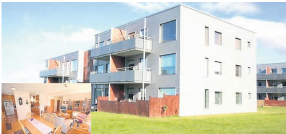
Íbúðin er í vönduðu fjölbýlishúsi í Mosfellsbæ.