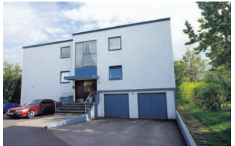
Húsið stendur á vinsælum stað. Hæð og ósamþykkt íbúð í kjallara.

Fold fasteignasala kynnr: Vel útbúna 82,5 fm íbúð á hæð ásamt góðri ósamþykktri séríbúð í kjallara á eftirsóttum stað í Reykjavík. Innbyggður bílskúr. Sæviðarsund 13 – OPIÐ HÚS MIÐVIKUDAG FRÁ KL. 17.30-18 – VERIÐ VELKOMIN!