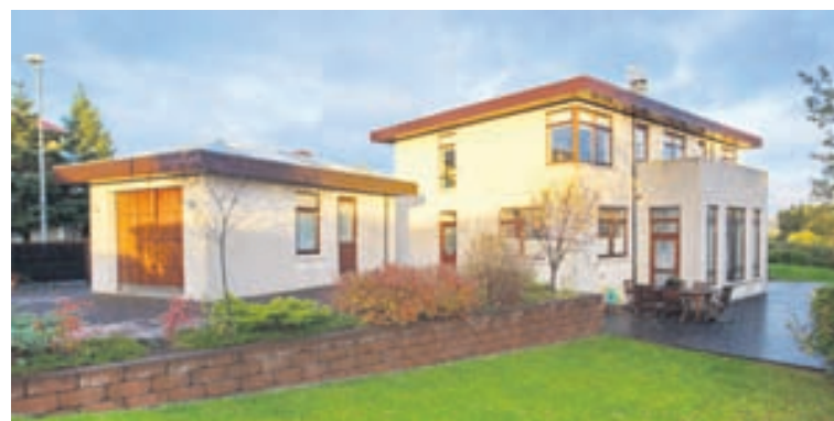
Húsið við Áland 1 er einstaklega glæsilegt.

Gengið er upp steiptan stiga á efri hæð hússins. Hún skiptist í stórt fjölskylduherbergi með vinnuádstöðu, sjónvarpsrými og þvottahúsi og svo baðherbergi, hjónaherbergi og barnaherbergi.