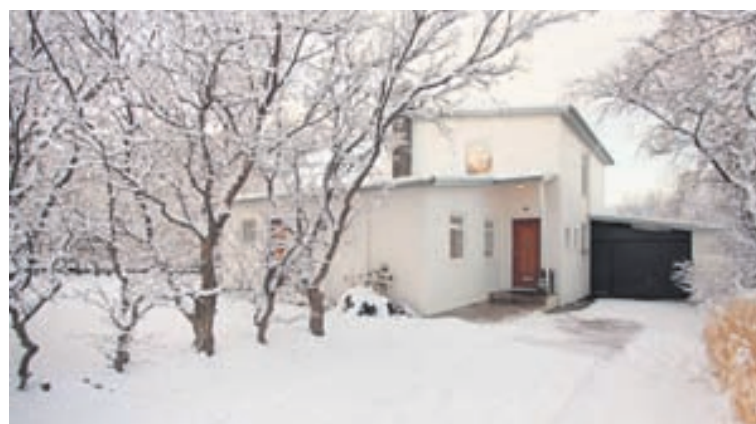
Einbýlishús við Vesturbrún 6. Opið hús í dag kl. 17.30 til 18.00.

Eldhúsið er rúmgott með sérsmíðaðri svartbæsaðri eikarinnréttingu, stór vinnuskápur er í innréttingu, innfelldur ísskápur, Miele-gaseldavél, -ofn og -uppþvottavél. Eldhúsbörðið er með innfelldri hvítri Carrara-marmaraplötu með mattri áferð. Sjónvarps-horn er við hlið eldhúss. Stofa og borðstofa eru samliggjandi og milli þeirra og eldhússins er veggur og