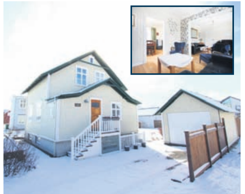
Gamalt hús í Skerjafirði sem var upphaflega í Skuggahverfinu í Reykjavík.

Eigendur hússins eru með rýmið í kjallaranum og útihúsinu í langtímaleigu á veturna og leigu