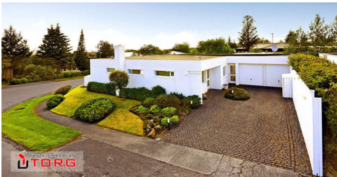
Fallegt og vel viðhaldið hús við Lindarflöt í Garðabæ.