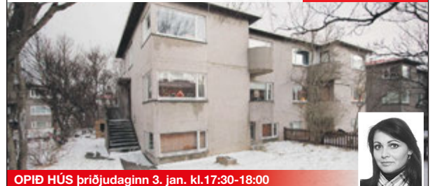
OPIÐ HÚS ÞRIÐJUDAGINN 3. JAN. KL. 17:30-18:00 Stærð: 84,7 m 2

Falleg og vel skipulögð 3ja herb. hæð í þrjúbýlishúsi á eftirsóttum stað í vesturbænum. Eignin skiptist í forstofuhól, eldhús, 2 svefnherbergi og stofu, annað herbergið var áður hluti af stofu og einfalt að breyta því aftur. S-svalir og gróinn garður. Þvottahús og geymsla í sameign.