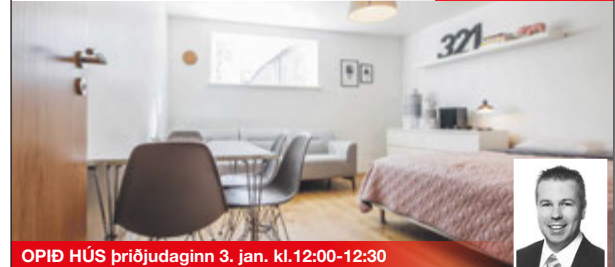
OPIÐ HÚS ÞRIÐJUDAGINN 3. JAN. KL. 12:00-12:30 Herbergi: 1 Stærð: 41 m 2

Falleg og björt eins-herbergja ósamþykkt íbúð með sér eldhúsi. Íbúðin er í kjallara með séringang. Skiptist í litla forstofu, stórt herbergi, baðherbergi með sturtu og rúmgóðu eldhúsi í sér herbergi. Eignin var nýlega mikið endurnýjuð ss. rafagnir og rafmagnstöflu, ofna og ofnalagnir. Útveggir einangraðir. Einnig voru gluggar og hurðir endurnýjaðar.