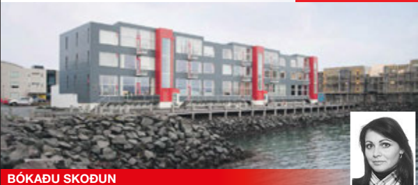
BÓKAÐU SKOÐUN Stærð: 161,0 m 2

Glæsileg 3ja herbergja íbúð ásamt bílskúr á 1.hæð með einstöku sjávarútsýni. Húsið er 3ja hæða lyftuhús með innangengt úr bílskúr í sameign. Íbúðin er vel búin vönduðum eikarinnréttingum og með stórar þaksvallir yfir bílskúr. Glæsilegn á vinsælum útsýnisstað í Sjálandinu.