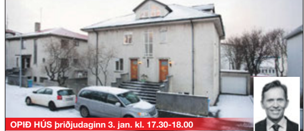
OPIÐ HÚS ÞRIÐJUDAGINN 3. JAN. KL. 17:30-18:00 Vidimelur 59 Stærð: 100,5 m 2

Falleg og björt íbúð með fjórum svefnherbergjum og tvennum svölum. Íbúðin er á annari hæð og í risi, með góðri nýtingu á plássi undir suð á rishæð. Á neðri hæðinni eru eldhús, borðstofa, stofa og baðherbergi. Úr stofu er gengið út á litlar svalir. Fallegt ljóst parket er á gólfum. Heildargólfmál ca 150 fm.