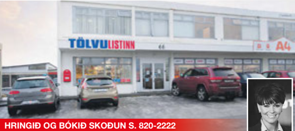
HRINGIÐ OG BÓKIÐ SKOÐUN S. 820-2222 Herbergi: 4 Stærð: 118,5 m 2

GÓÐUR LEIGUSAMNINGUR MEÐ TRAUSTUM LEIGUTAKA FYLGIR, GOTT FJÁRFESTINGARTÆKIFÆRI. Um er að ræða mjög gott verslunarhúsnæði á frábærum stað í Hafnarfirði. Eignin er á jarðhæð með góðu aðgengi beint af bílastæði. Mikil er af bílastæðum beint fyrir framan eignina.