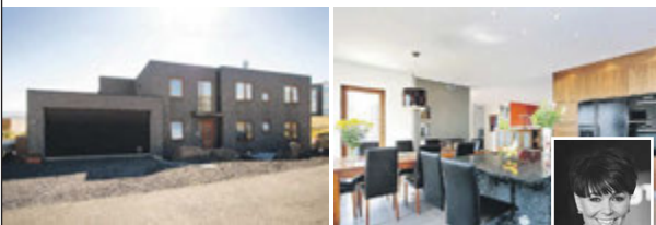
HRINGIÐ OG BÓKIÐ SKOÐUN S. 820-2222 Herbergi: 8 Stærð: 330,1 m 2

Glæsilegt einbýlishús með innbyggðum bílskúr og tveggja herbergja aukaíbúð á jarðhæð. Eignin er skráð 330,1 fm. Þar af er bílskúr 45,6 fm og aukaíbúðin ca 35-40. Stórkostlegt útsýni er yfir Elliðaavatn, mikil lofthæð og innbyggð lýsing er í loftum. Tveir fallegir arnar eru í húsinu og sérsmíðaðar innréttingar teiknaðar af Guðrúnu Atladóttur innanhúsarkitekt. Parket og flísar eru á gólfum og hnotuviður er í innréttingum og hurðum.