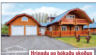
Hringdu og bókaðu skoðun

234,8 m 2 einbýlishús á tveimur hæðum og rúmgóðum tvöföldum bílskúr við Asparlundur 1 í Mosfellsbæ. Eignin skiptist í fjögur herbergi, baðherbergi, gestasnyrtingu, þvottahús, forstofu, sjónvarpsbol, stofu og borðstofu. Rúmgóður bílskúr og er geymsla innaf honum og gott geymslu loft. 940 m 2 eignarlóð. Stórar timburverandir og fallegur garður. V. 76,5 m