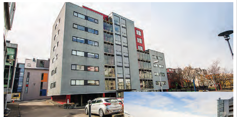
Íbúðin er á 7. hæð á Lindargötu 27.

Íbúðin er 160,2 fm ásamt 11,2 fm geymslu og 24,1 fm innbyggðum bílskúr, samtals 195,5 fm. Húsið er átta hæða fjölbýlishús með 21 íbúð. Tvær íbúðir eru á 7. hæð og ein á 8. hæð. Bílskúrin er á 1. hæð ásamt innganginum í húsið sem og hjóla- og vagnageymslu og sorpgeymslu. Geymslan er í kjallara. Sameignin er öll hin snyrtilegasta. Þegar inn er komið tekur við flísalögð forstofa með fataskáp. Inn af forstofu er baðherbergi flísalagt í hól og gólf, upphengt salerni, sturtuklefi og gluggi. Stórt hjónaherbergi með góðu skáplássu ásamt flísalögðu baðherbergi og þvottahúsi inn af. Upphengt salerni, sturtuklefi, innrétting, handklæðaofn og gluggi. Eldhúsið er glæsilegt með hvítri