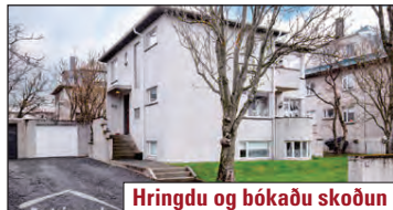
Hringdu og bókaðu skoðun

Falleg og mikið endurnýjuð 2ja. herbergja íbúð í kjallara við Víðimel 60 í Reykjavík. Íbúðin skiptist í svefnherbergi, stofu, borðstofu, eldhús og baðherbergi. Sérgeymsla með glugga og köld útgeymsla. V. 32,9 m.