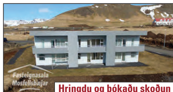
Hringdu og bókaðu skoðun

Ný fullbúin 180 m 2 raðhús á tveimur hæðum. Á jarðhæð eru svefnherbergi, baðherbergi, þvottaherbergi og fataherbergi. Á efri hæðinni er bílskúr, forstofa, geymsla, eldhús og svalir. V. 67,9 og 69,9 m.