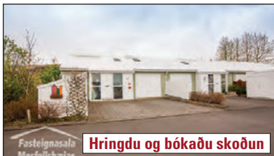
Hringdu og bókaðu skoðun

Mjög fallegt 154,0 m 2 endarahúsið á einni hæð með vinnustofu (studio íbúð) á fallægum stað við Björtuhlíð 27 í Mosfellsbæ. Húsið skiptist í forstofu, hol, stofu, eldhús, baðherbergi, þrjú svefnherbergi, eitt herbergi m/rislofti er í hluta bílskúrs. Við hlið hússins er 29,4 m 2 vinnustofa (stúdíó íbúð) með baðherbergi og eldhúskrók. V. 63,9 m.