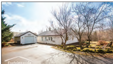
Laus strax Hringdu og bókaðu skoðun

Fallegt 218,4 m 2 einbýlishús á 3.550 m 2 gróinni eignarlóð við Sólbakka í Mosfellsbæ. Um er að ræða fallegt 153,4 m 2 einbýlishús með 2-3 svefnherbergjum, stofu, borðstofu eldhúsi, baðherbergi, þvottahúsi, ásamt 65 m 2 bílskúr sem skiptist í bílskúr og aukaíbúð með stofu, eldhúskrók, svefnherbergi, svefnlofti og baðherbergi. Lóðin er sérlega falleg með miklum trjágróðri, pöllum og grasflöt. Aðkoma að húsinu og bílapan er malbikað. V. 75,0 m.