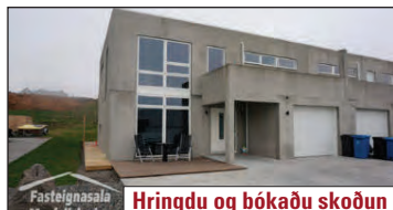
Hringdu og bókaðu skoðun

Mjög fallegt og vel skipulagt 243,5 m 2 endarahúsið á tveimur hæðum með bílskúr. Vönduð gólfefni, innréttingar og tæki. Innfelld lýsing. Hiti er í gólfum. Steypt bílapan. Tvær timburverandir og tvennar svalir. Fallegt útsýni. V. 79,9 m.