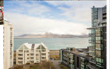
Útsýnið úr íbúðinni er afar gott.

Nánari upplýsingar í síma 552-1400. Þjónustusimar eftir lokun: 895-7205, 694-1401 og 893-9132. www.fold.is