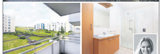
OPIÐ HÚS mánudaginn 31. Júlí kl.18:30-19:00 Herbergi: 2 Stærð: 74,5 m 2

Björt og góð 2ja herb. íbúð, fyrir 50 ára og eldri, á annari hæð með góðum svölum. Íbúðin er með parket á gólf. Gott svefnherbergi, með stórum fataskáp. Baðherbergi flísalagt í hólf og gólf, með sturtuklefa og handklæðaðfni á vegg. Eldhús með AEG ofni, helluborði og háfi. Gott skápafláss. Inn af eldhúsi er þvottaherbergi.