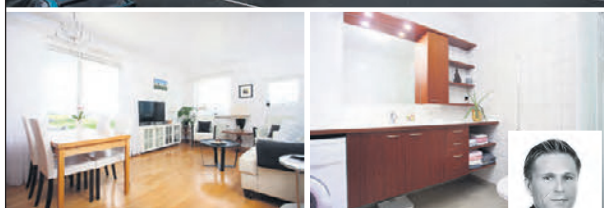
HRINGIÐ OG BÓKID SKOÐUN 694-4700 Herbergi: 2 Stærð: 78 m 2

Íbúð fyrir 60 ára og eldri. Góð 3ja herb. enda-íbúð á annari hæð með tvennar svalir, önnur með svalalokun.