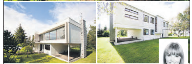
OPIÐ HÚS þriðjudaginn 1. ágúst kl. 18:00-19:00 Herbergi: 8 Stærð: 248,9 m 2

*Einstök hönnun Kjartans Sveinssonar*. Einbýli á tveimur hæðum með innbyggðum bílskúr. Á efri hæð eru tvö herbergi, hjónaherb. með fataherb. og baðherb inn af, gestabað með sturtu, eldhús, borðstofa og tvö stofurými. Á neðri hæð eru tvö svefnherbergi, lítið eldhús, möguleiki á gestasalerni og þvottahús með útgengi út í garð. Í dag er rekin heimagisting í eigninni með samþykktu starfsleyfi. Hér er um að ræða eign sem býður upp á mikla möguleika. Húsið þarfnast viðgerðar utanhúss.