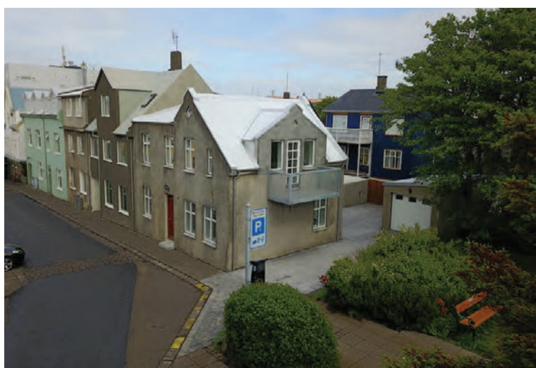
Þetta hús við Þórsgötu hefur allt verið gert upp og er nú til sölu.

Stiginn á efri hæð er fallegur með sérsmiðuðu handriði frá Járnprýði. Geymsla er undir stiganum. Parket á gólfum frá Harðviðarvali og flísar frá Agli Árnasyni. Fallegar innihurðir sem voru sérpantaðar. Ekki hefur verið búið í eigninni í tvo áratugi. Árið 2015 hófust framkvæmdir af viðurkenndum verktaka. Eignin