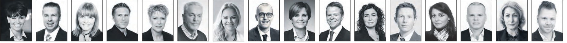
Hafðís Fasteignasali 820 2222 | Sigurður Fasteignasali 898 6106 | Dórothea Fasteignasali 898 3326 | Þorsteinn Fasteignasali 694 4700 | Jóhanna Kristín Fasteignasali 698 7695 | Árni Ólafur Fasteignasali 893 4416 | Berglind Fasteignasali 694 4000 | Jón Gunnar Fasteignasali 848 7099 | Sigríður Fasteignasali 699 4610 | Garðar Fasteignasali 899 8811 | Hrönn Sölufultrúi 692 3344 | Hólmgeir Lögmaður 520 9595 | Þóra Fasteignasali 822 2225 | Þorgeir Fasteignasali 696 6580 | Lilja Sölufultrúi 663 0464 | Hafliði Fasteignasali 846 4960