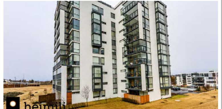
Falleg íbúð er til sölu í Lundi í Kópavogi.

Hjónaherbergi er rúmgott með fataherbergi, einnig er útgengi á svalirnar úr hjónaherberginu. Bað-