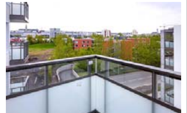
Fallegt útsýni er frá svölum.