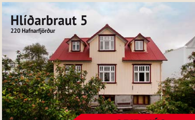
Hlíðarbraut 5 220 Hafnarfjörður