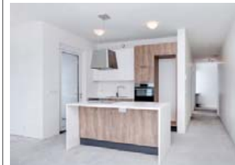
Eldhúsið er miðsvæðis með þægilegri eyju.