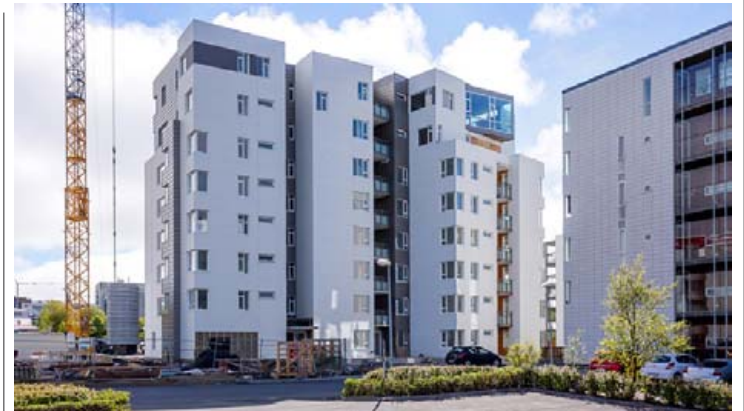
Íbúðir eru komnar í sölu í nýbyggingu við Mánatún.