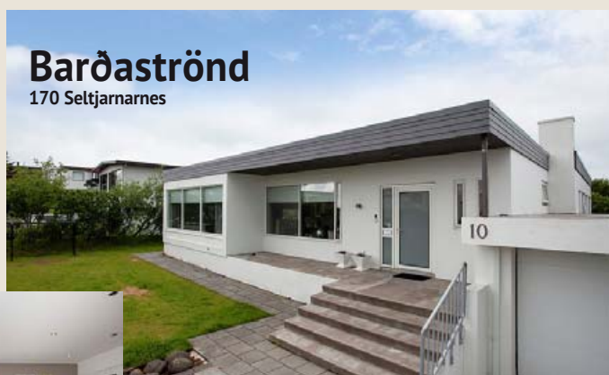
Barðaströnd 170 Seltjarnarnes