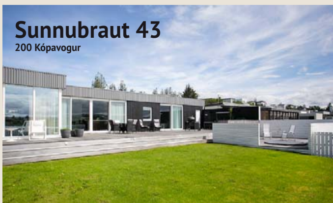
Sunnubraut 43 200 Kópavogur