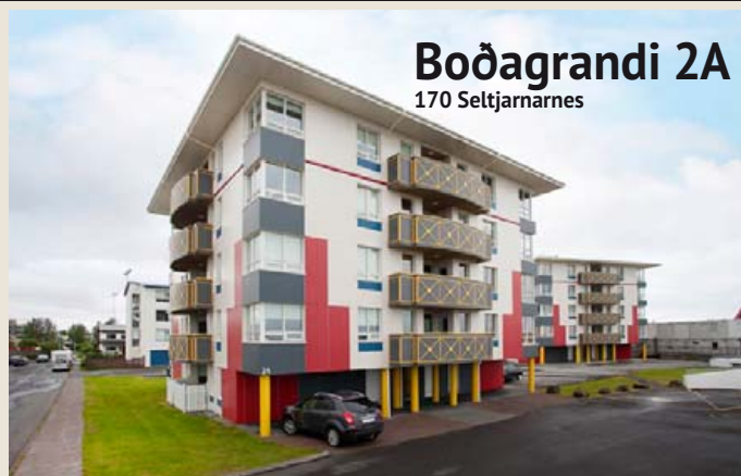
Boðagrandi 2A 170 Seltjarnarnes

Mjög falleg og vel skipulögð 111,3 fm íbúð á jarðhæð með tveimur afgirtum veröndum og stæði í bílageymslu í nýlegu lyftuhúsi á eftirsóttum stað í vesturbænum