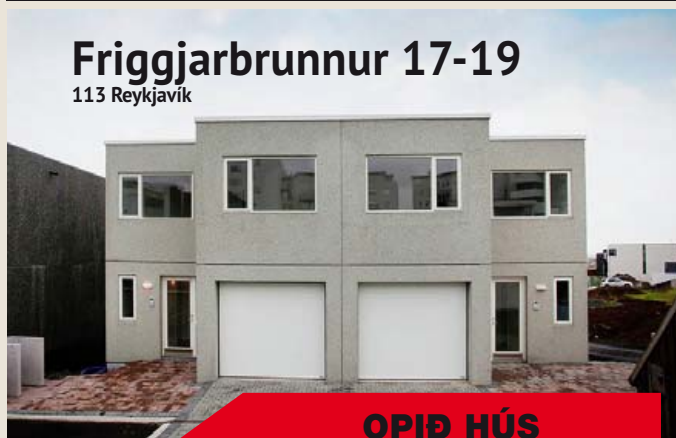
Friggjarbrunnur 17-19 113 Reykjavík