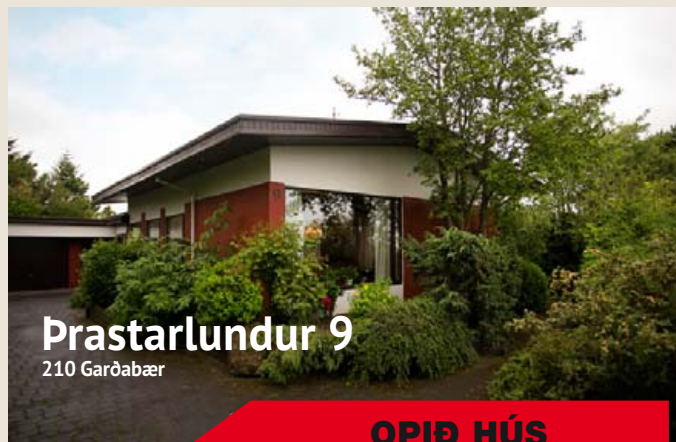
Prastarlundur 9 210 Garðabær