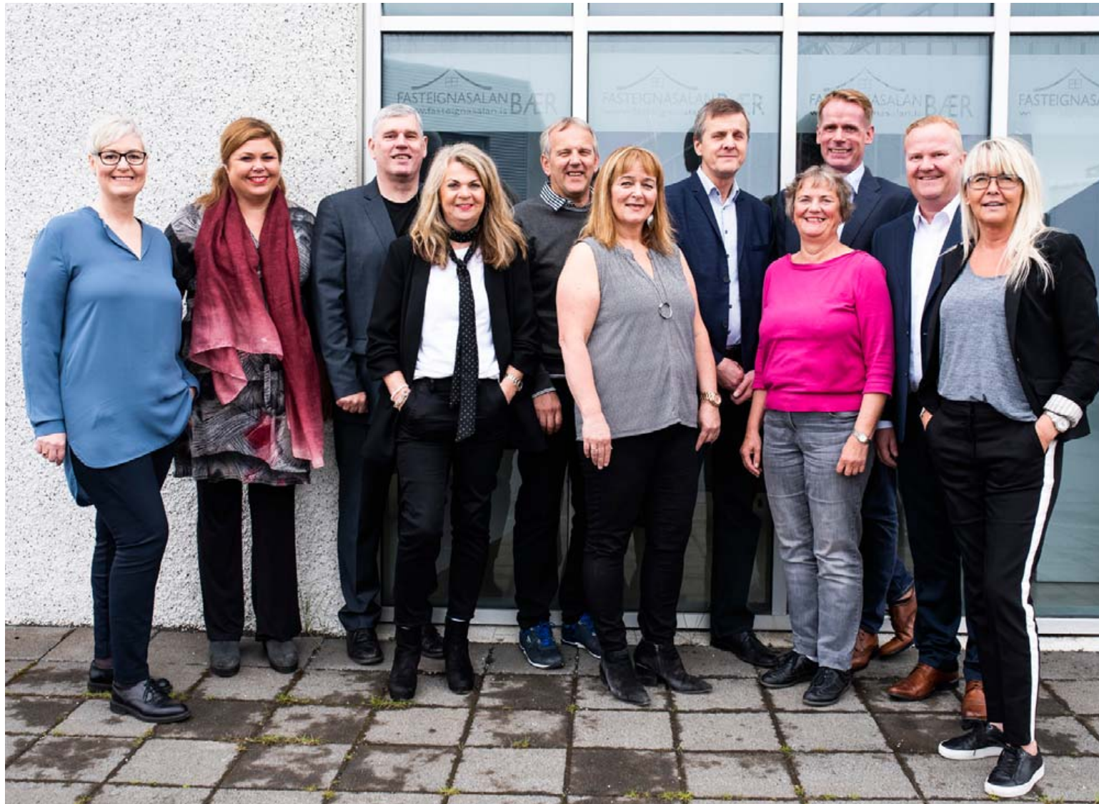
Reynslumikill hópur starfar á Fasteignasölu Bæ. Á myndina vantar nokkra starfsmenn vegna sumarleyfa.

„Um tíma seldust allar eignir og yfirleitt mjög hratt og þá jafnvel á yfirverði. Síðan hefur markaðurinn verið að leita jafnvægis. Hægt hefur mjög á hækkanum og fólk er lengur