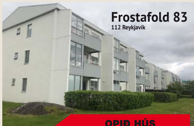
Frostafold 83 112 Reykjavík