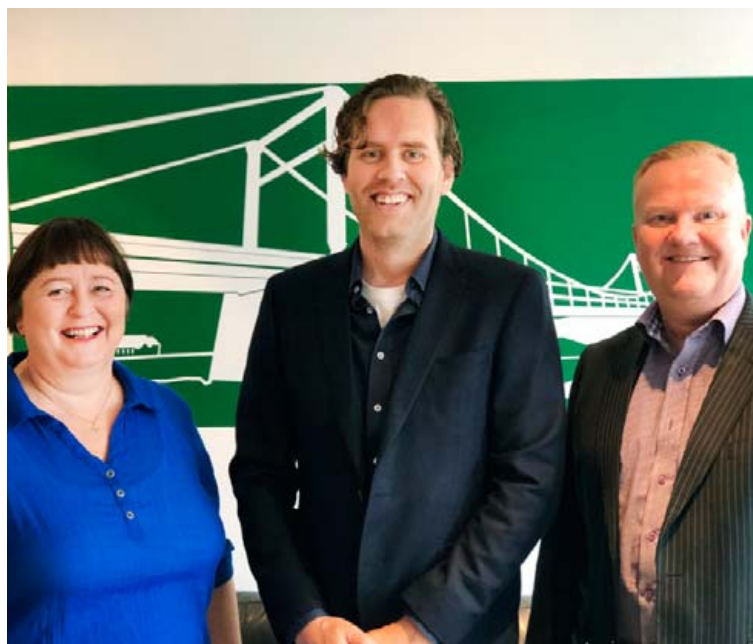
Starfslið útibúsins á Selfossi annast sölu fasteigna á Suðurlandi og víðar.

„Fasteignamarkaðurinn á Suðurlandi hefur tilhneigingu til þess að elta markaðinn á höfuðborgarsvæðinu, hvort heldur sem um er að ræða hækkanir eða lækkanir og lengd sölutíma. Breytingarnar á hvorn veginn sem er gerast hægar og á lengri tíma. Gríðarleg umsvif hafa verið á Selfossi og í Hveragerði og mikil sala