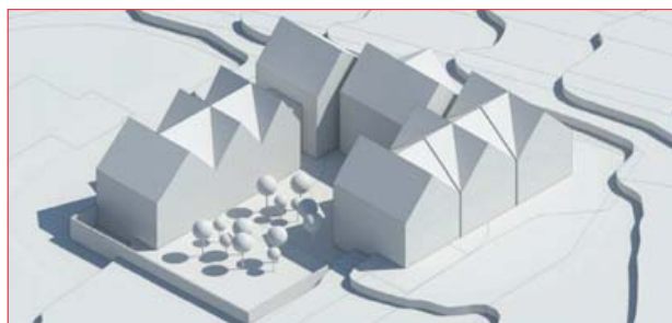
Tekning og hugmyndir: Hornsteinar arkitektar

Húsnæðinu hefur verið breytt í skrifstofuhúsnæði og er tilvalið að breyta í íbúðir. Samþykktur er 1.280 fm byggingarréttur fyrir stækkun, svo kjörið er að breyta þessu í fallega íbúðabyggð á besta stað í borginni, steinsnar frá 2 háskólum, leik- og barnaskóla.