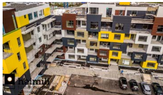
Fallegt fjölbýli við Bæjarlind í Kópavogi. Íbúðirnar eru rúmgóðar og fallegar.

Hefðbundin lýsing á íbúð: Komið er inn í anddyri með fataskáp, frá anddyri er gengið inn í herbergi og gestasalerni. Herbergi með fataskáp, útgengi út á svalir. Gestasalerni: flisar á veggjum og á gólf, litil innrétting. Stofa, borðstofa og eldhús í opnu rými, útgengi út á stórar svalir. Þvottahús og búr; flisar á gólf, innrétting. Baðherbergi með innréttingu, flisar á veggjum og gólf, sturtuklefi, handklæðaoafn. Frá hjónaherbergi er glæsilegt útsýni.