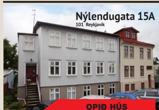
Nýlendumgata 15A 101 Reykjavík