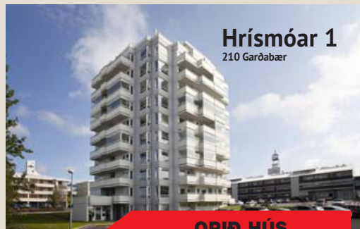
Hrísmóar 1 210 Garðabær