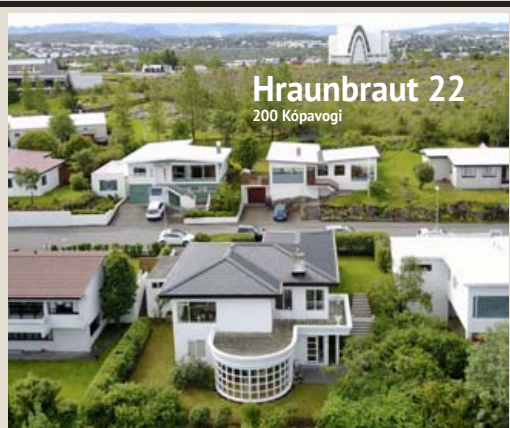
Hraunbraut 22 200 Kópavogi

Hraunbraut 22 í Kópavogi Tveggja íbúða fjölskylduhús 253 fm á tveimur hæðum. Fallegt útsýni til Reykjavíkur