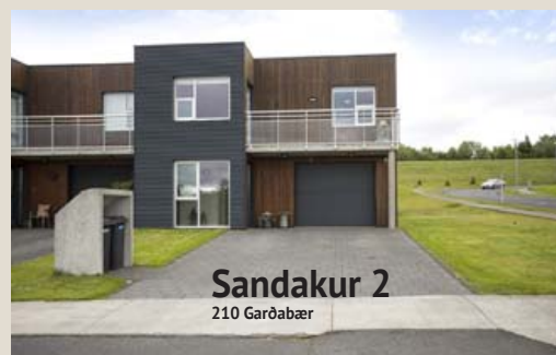
Sandakur 2 210 Garðabær

Sérlega vel skipulagt og fallegt 242,6 fm endaraðhús á skjólsælum stað á miðri Arnarneshæðinni Húsið er glæsilegt ásýndum þar sem það er ýmist klætt áli eða harðviði Húsið snýr í suð- suðvestur þannig að það nýtur sólár allan daginn Einstaklega vel hönnuð hjónasvita er í húsinu