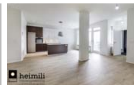
Stofa, borðstofa og eldhús er í opnu rými.

Allar frekari upplýsingar eru veittar á Heimili fasteignasölu, sími 530-6500.