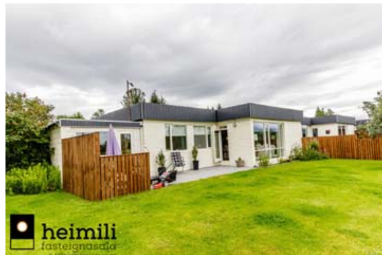
Fallegt hús við Skógarlund í Garðabæ.

Komið er inn í flisalagða forstofu með fataskápum. Gestasalerni og þvottahús er inn af forstofu. Stórar stofur með parketi á gólfi og útgangi á hellulagða verönd í bakgarði. Eldhús með borðkrók og eldri endurbættir innréttingu. Sjónvarpsstofa skilin frá stofu og eldhúsi með löttum vegg. Í svefnálmu eru fjögur svefnherbergið.