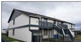
Hringdu og bókaðu skoðun

93 m 2 , 4ra herbergja íbúð með sérinnangi á jarðhæð í fjórþýlishúsi. Eignin skiptist í þrjú svefnerbergi, þvottahús, baðherbergi, stofu, eldhús og geymslu. V. 43,9 m.