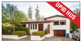
Opíð hús þriðjudaginn 20. nóvember frá kl. 17:00 til 17:30

Fallegt 241,2 m 2 einþýlishús þar af er bílskúrinn 63,2 m 2 bílskúr. Stórt hellulagt bílapan og hellulögð gönguleið að húsinu. Timburvernd með heitum potti. Á aðalhæðinni þrjú svefnerbergi, tvö baðherbergi, þvottahús, forstofa, eldhús, stofa, borðstofa og sjónvarpsstofa. Á neðri hæðinni er rúmgott herbergi, sjónvarpsbol, vinnurými og anddyri. V. 81,9 m.