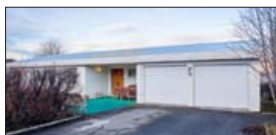
Opíð hús mánudaginn 19. nóvember frá kl. 17:00 til 17:30

Fallegt 195,5 m 2 einþýlishús á einni hæð með rúmgóðum bílskúr með tveimur innkeyrslu- hurðum á útsýnisstað. Timburvernd með heitum potti. Glæsilegt útsýni. Stórt steypt bílapan. Eignin hefur verið mikið endurnýjuð á síðastu árum. V. 82,4 m.