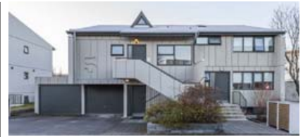
Opíð hús verður á Grímshaga í dag.

Hringstigi úr stofu niður á neðri hæðina þar sem er