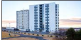
Opíð hús mánudaginn 19. nóvember frá kl. 17:00 til 17:30

Mjög falleg 124,1 m 2 4ra herbergja íbúð á 5. hæð, ásamt bílastæði í bílarkjallara í lyftuhúsi. Glæsilegt útsýni. Gott skipulag. Fallegar innréttingar og gólfefni. V. 60,9 m.