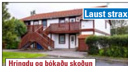
Hringdu og bókaðu skoðun

94,2 m 2 , 4ra herbergja íbúð með sér inngangi á 2. hæð. Eignin skiptist í stofu, eldhús, þrjú svefnerbergi, baðherbergi og þvottahús. Frábær staðsetning. Rétt við skóla, leikskóla, sundlaug og golfvöll. V. 39,9 m.