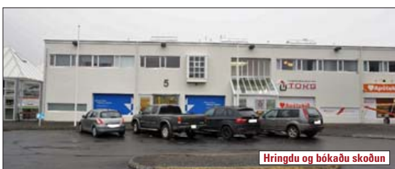
Hringdu og bókaðu skoðun

634,1 m 2 skrifstofuhúsnæði í miðbæ Garðabæjar. Eignin er á tveimur fastanúmerum. Eign 01-01 sem er skráð 373,3 m 2 , þar af rými í kjallara skráð 97,6 m 2 og eign 02-01 sem er skráð 260,8 m 2 . Hluti efri hæðar er í leigu í dag með húsaleigusamning sem gildir út 31.03.2021. V. 160,0 m.