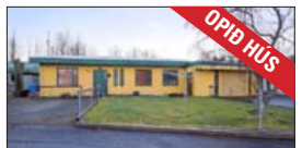
Opíð hús þriðjudaginn 20. nóvember frá kl. 18:00 til 18:30

203,1 m 2 einþýlishús á einni hæð með bílskúr sem hefur verið innréttaður sem 2ja herbergja íbúð. Eignin skiptist í fjögur herbergi, baðherbergi, gestasnyrtungu, þvottahús, forstofu, geymslu, eldhús, stofu, borðstofu og bílskúr. V. 75,9 m.