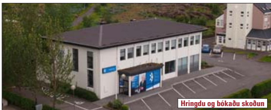
Hringdu og bókaðu skoðun

Heildareignin Þverholt 1 í Mosfellsbæ sem er skrifstofuhúsnæði á tveimur hæðum og kjallara, auk þess fylgir eigninni 364 m 2 byggingarreitur. Birt stærð eignarinnar eru 706,9 m 2 , þar af 372,4 m 2 skrifstofurými og afgreiðslusalur á 1. hæð, 249,4 m 2 skrifstofur og matsalur á 2. hæð og 85,1 m 2 geymslu/tæknirými í kjallara. V. 180,0 m.