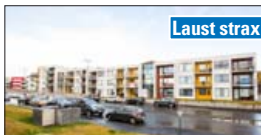
Hringdu og bókaðu skoðun

Ný fullbúin 63,1 m 2 , 2ja herbergja íbúð á 3. hæð, ásamt bílastæði í bílageymslu í lyftuhúsi. Falleg gólfefni, vandaðar innréttingar, innbyggður kaffi- og frystiskápur, innbyggð uppþvottavél og gluggagjöld frá Álínabæ. V. 35,9.