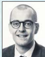
Jón Gunnar Fasteignasali