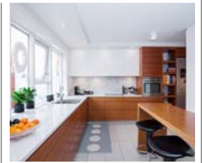
Eldhúsið er nýlega uppgert.