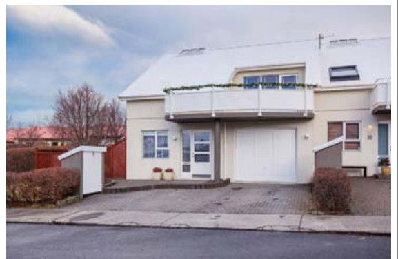
Húsið er við Draumahæð í Garðabæ.

Bílskurinn er snyrtilegur með hillum og máluðu gólf. Um er að