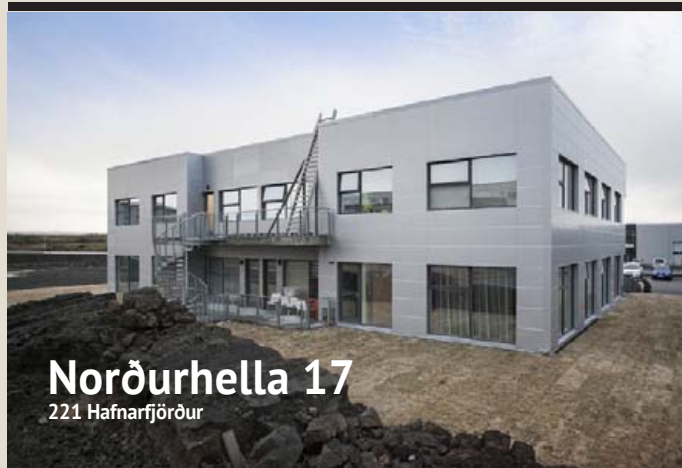
Norðurhella 17 221 Hafnarfjörður

Nýlegt 907,9 fm gistiheimili með 24 íbúðum Leigusamningur til 7 ára með 3,6 millj pr mánuð fylgir - árs trygging Allar íbúðirnar eru með eldhús og baðherbergi með góðum innréttingum Lóðin er 2124 fm og frágengin með fjölda bílastæða Húsnæðið er allt nýlega innréttað Mikil arðsemi af eigninni