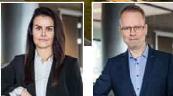
ERLA 692 0149 ÓLAFUR 663 2508

Opið hús alla virka daga klukkan milli klukkan 12 og 13, og milli klukkan 17 og 18 Vandaðar 127 fermetra fjögura herbergja endaíbúðir á annari, þriðju, fimmtu og sjöundu hæð með sérlega stórum svölum og miklu útsýni. Íbúðirnar afhendast fullbúnar með gólfefnum, fataskápum og eldhústækjum þar með talið ísskáp og uppþvottavél. Íbúðin skiptist í rúmgott anddyri með fataskáp, hjónaherbergi með fatah. innaf, tvö barnah. með fataskápum, annað með tveimur gluggum, flísalagt baðh.