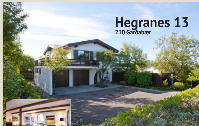
Hegrarnes 13 210 Garðabær

Reisulegt og sjarmerandi um 340 fm einbýlishús Húsið stendur á stórra og fallegri eignarlóð Innra skipulag er gott og býður uppá möguleika. Stór og falleg stofurými með útsýni og arni. 6 svefnherbergi, 3 baðherb, tvöfaldur bílskúr Möguleiki að nýta neðri hæð að hluta sem íbúð