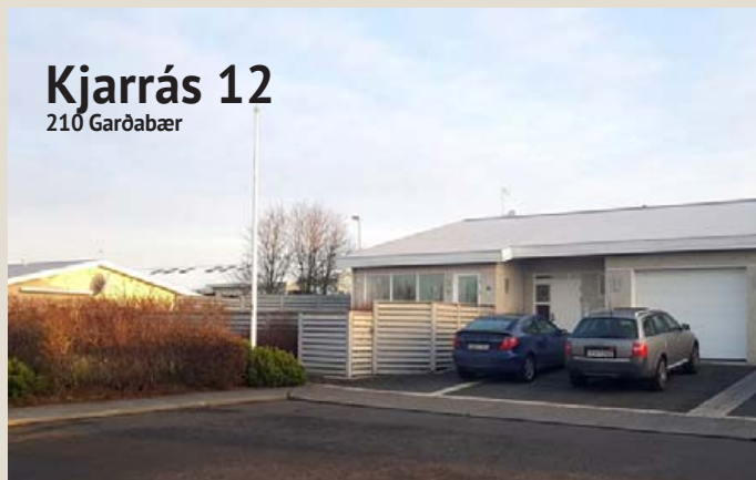
Kjarrás 12 210 Garðabær

Fallegt og mjög vel skipulagt endaraðhús Innst í botnlanga, eftirsótt staðsetning Stór, björt og falleg alrými með útg. á verönd Fjögur herbergi liggja að svefnherbergisgangi Gott baðherbergi, gestasnyrting og sér þvottahús