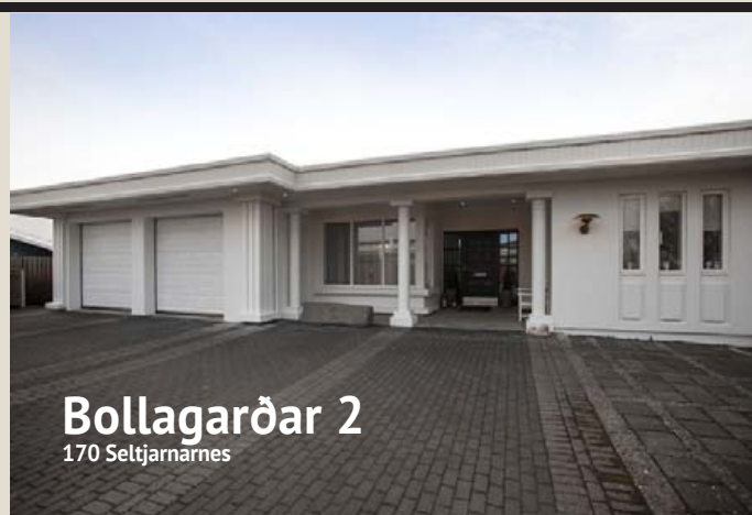
Bollagarðar 2 170 Seltjarnarnes

Virkilega glæsilegt, algjörlega endurnýjað og vel skipulagt 319,2 fermetra einbýlishús á einni hæð á glæsilegri 845,0 fermetra afgirtri lóð á eftirsóttum stað á Seltjarnarnesi. Aukin lofthæð er í húsinu að mestu og virkilega falleg gluggasetning gerir það mjög bjart og skemmtilegt