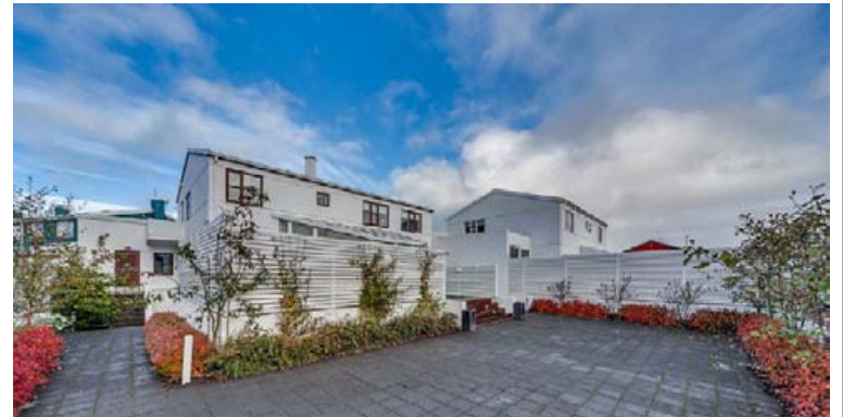
Glæsilegt og nýlega endurnýjað einbýli á Seltjarnarnesi er til sölu.

Samliggjandi rúmgóðar stofur með nýjum glæsilegum arni eftir Jón Eldon. Opnað hefur verið úr stofum í sólskála með útgengi á lóð. Eldhúsið er rúmgott með fallegum sérsmíðuðum innréttingum og vönduðum innbyggðum tækjum, tveimur ofnum og innbyggðri uppþvottavél frá Miele, útgangur á verönd til austurs með skjólveggjum. Á efri hæð er sjónvarpshol.